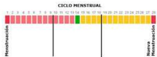
En una mujer con un ciclo regular de 28 días

En la última fase del ciclo menstrual, llamada fase postovulatoria, es cuando el endometrio, que se había estado haciendo grueso como preparación para recibir, implantar y nutrir al óvulo fecundado, se desprende. Esto ocurre cuando el óvulo que fue expulsado del ovario para ser fecundado no es fertilizado, dándose el proceso de menstruación.