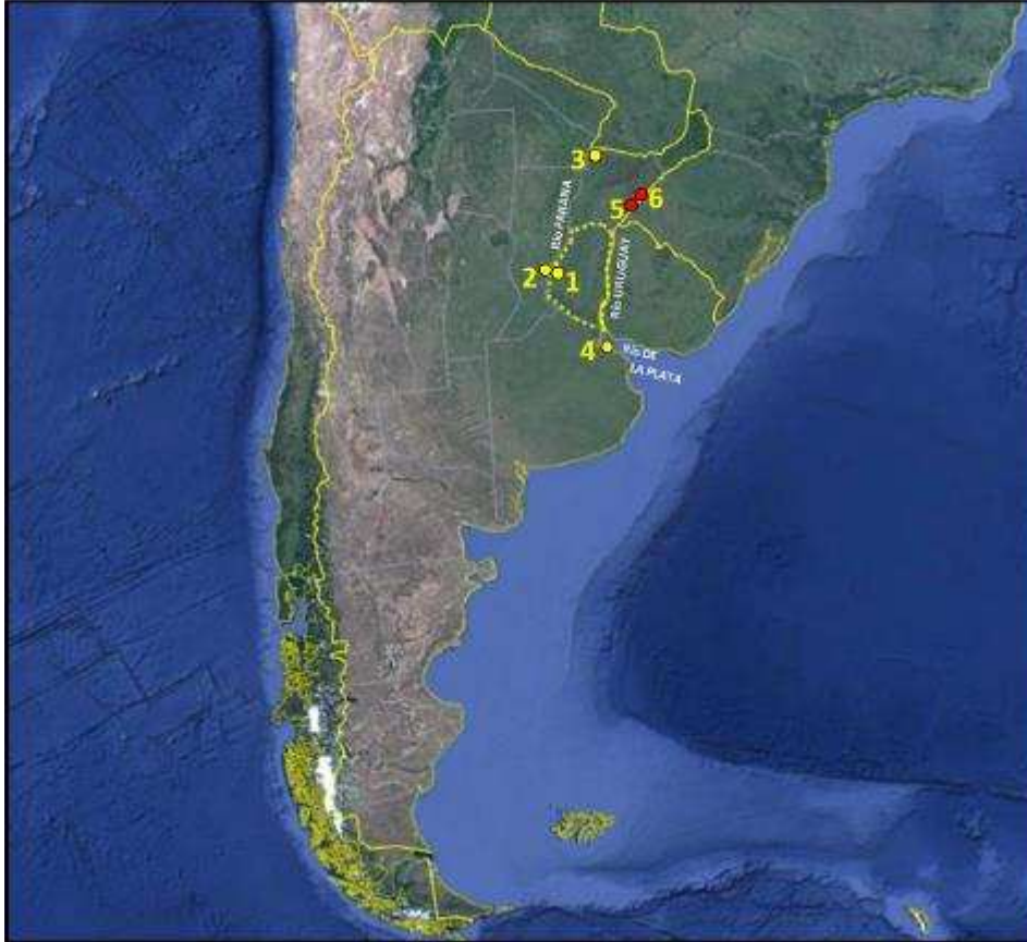
Figura 1. Sobre imagen satelital del cono sur sudamericano con su actual delimitación política, se destaca con línea de puntos la provincia de Entre Ríos (Argentina). Se identifican los ríos Paraná y Uruguay, y los pueblos y ciudades mencionados en el texto. En amarillo: Paraná (1); Santa Fe (2); Corrientes (3); Buenos Aires (4). En rojo, los pueblos jesuítico-guaraníes ubicados más al sur: Yapeyú (5), y La Cruz (6).