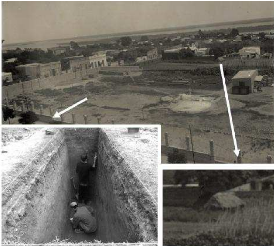
Figura 5. Sobre fotografía del Ministerio de Obras Públicas tomada desde la terraza del Colegio Nacional en 1925, indicamos la presencia hacia entonces de un rancho con techo de paja, probablemente remanente de los que allí se alzaban durante el siglo XIX, y el sector donde se excavó un sondeo arqueológico.

donde identificamos una potencia de 2,6m, debajo de la cual se halla el piso que habría estado expuesto hasta entonces. En excavaciones realizadas allí en 2018, no se registró materialidad arqueológica asociada al antiguo piso de ocupación (Figura 5).