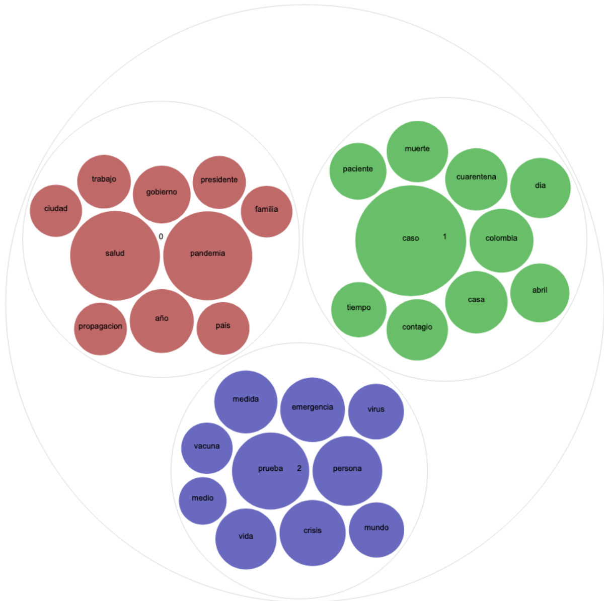
Figura 2. Tópicos de Colombia, 25 de abril de 2020. Elaboración propia.

debe destacar que en el corpus general la información sobre número de casos positivos, muertes, pacientes recuperados, hospitalizaciones, camas disponibles, etc., fue denominada Estadísticas , y se trató de un tópico consistente en todas las regiones y períodos, pues emergió con claridad en todas las experiencias realizadas; además se puede observar en el modelo una preponderancia en recuentos (número de casos, infectados, muertos), medidas sanitarias y cuestiones políticas (como medidas de prevención). De manera similar, se pudo estimar que los tweets de este tópico provenían normalmente de cuentas institucionales o de medios de comunicación y se focalizaron en diferentes escalas (global, nacional, local, institucional, etc.) a lo largo de la pandemia.