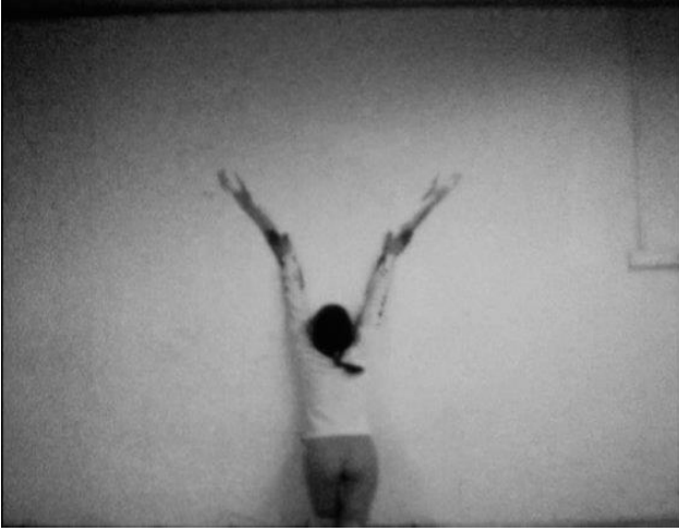
Ana Mendieta, Huellas .

El tema de la memoria y el arte es central en esta cartografía de los feminismos descoloniales. 58 No sólo desde la perspectiva nomádica que Rosi Braidotti señala como central en la conciencia crítica de los conocimientos subyugados. 59