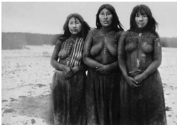
Fig. 1. Selknam. Fotografía de Martín Gusinde, 1923.

para el ritual del hain , luciendo sus cuerpos desnudos y pintados con diseños geométricos en arcilla roja y blanca. 62