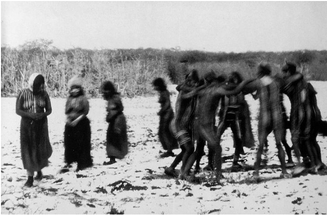
Fig. 2. Los selknam. 1923.

Nunca una mujer debe enterarse de lo que los hombres hacemos aquí en la choza del Klóketen. ¡El último de nosotros debe llevarse a la tumba este secreto de los hombres! 64