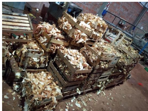
Descartes de la cooperativa