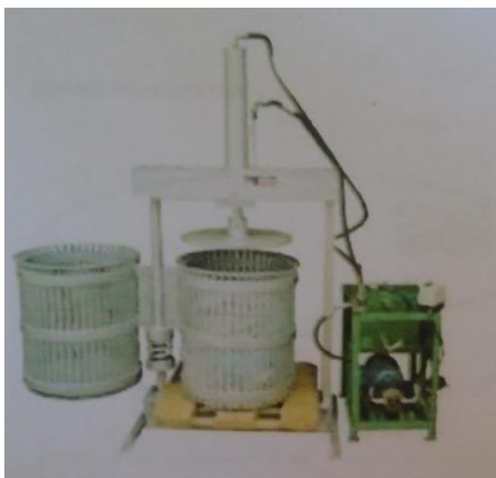
Fragmento del folleto de la prensa

Los folletos constituyeron un marco implícito de interpretación para el diseño del conjunto que los estudiantes fueron plasmando en búsquedas bibliográficas de antecedentes, borradores de informes, y luego en sucesivas inscripciones gráficas donde plasmaban sus avances: existiendo distintas opciones manuales e industriales para prensar la mandioca tales como los tornillos extrusores o las prensas, la elección de la segunda opción por parte de la cooperativa fue asumida como meta del equipo universitario, delimitando un rango de alternativas técnicas para los diseños.