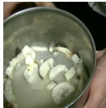
Ensayos iniciales de la prensa