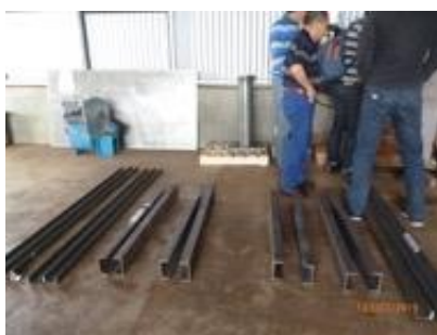
Perfiles organizados para su identificación

Durante esas conversaciones, que se prolongaron por varias horas, el mecánico consultó al profesor por la ubicación de un perfil en el plano de despiece, consultando si era posible colocar refuerzos de chapas en el ensamblado para que no se “panzee” -expresión coloquial que alude metafóricamente a una flexión no deseada del metal-. El profesor accedió a la adaptación propuesta por el mecánico