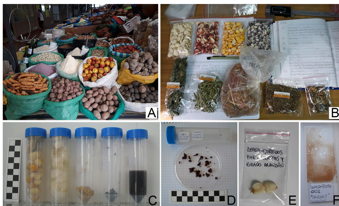
Fig. 2. Etapas del protocolo propuesto para el registro y catalogación de los ejemplares de la colección. A) Obtención de ejemplares en el Mercado de La Quiaca, Jujuy, Argentina. B) Catalogación e inventario del material en estado seco en el gabinete del Herbario JUA. C) Catalogación e inventario de las preparaciones culinarias en el gabinete arqueobotánico. D) Descripción macroscópica de las preparaciones culinarias. E) Bodegaje de material en estado fresco/húmedo. F) Montaje de las muestras de la colección histológica.

Las etapas del protocolo seguido para el registro y catalogación de los ejemplares de la colección incluyen: Fig. 2A) la obtención de ejemplares en mercados, ferias