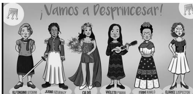
Figura 2. Fragmento página web de Chirimbote.

La colección se presenta en su página web con una imagen: se observa en un campo a Violeta Parra tocando la guitarra, conversando con Juana Azurduy y Frida Kalho. De esta manera, a través de un epígrafe, se sostiene que siempre hubo “mujeres libres e independientes y grandes artistas latinoamericanos”, luego caracterizadas como “heroínas de carne y hueso” (página web de Chirimbote).