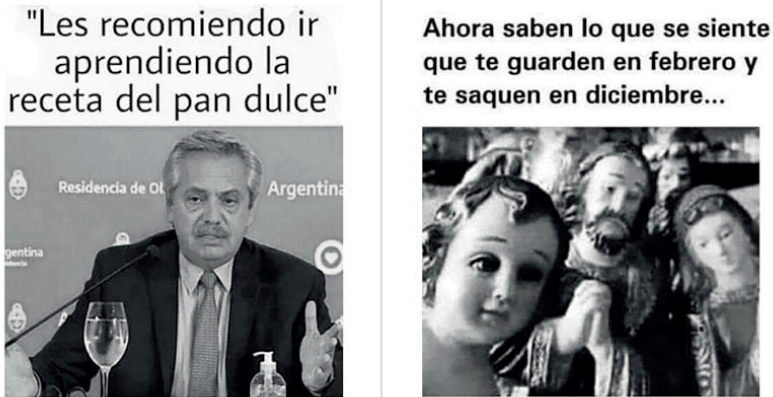
Figura 8 - Memes y gestión de la política sanitaria (duración del ASPO)