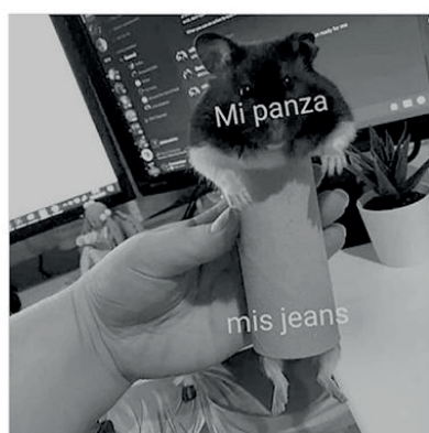
Figura 4 - Memes, vida cotidiana e incumplimiento de los mandatos del ASPO