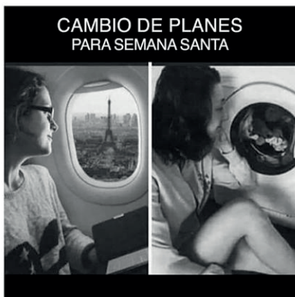
Figura 2 - Memes, vida cotidiana y quehaceres domésticos