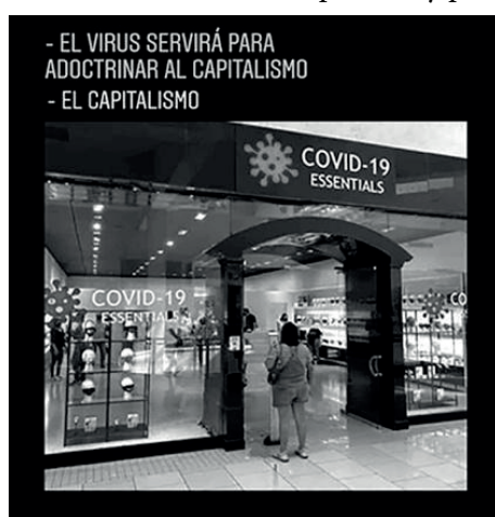
Figura 13 - Memes, sistema capitalista y pandemia

la desigualdad, y el pesimismo de quienes avizoran que nada cambiará (KESSLER; BENZA, 2020). Como ejemplo del primer caso, elegimos el meme de la Figura 13 que trae a escena, a través del recurso de la ironía, la narrativa sobre el fin del capitalismo o, menos ambicioso, la crisis del modelo de desarroll neoliberal criticada por Menéndez (2020) y propuesta por autores como ŽIŽEK (2020) con su concepto de comunismo o Zibechi (2020) con su idea de destrucción de la globalización neoliberal, ofreciendo otra mirada: no solamente la incapacidad de “adoc-trinar” al capitalismo, sino inclusive su capacidad adaptativa, aun con sus recurrentes crisis. Más allá de la ironía, se trata de una respuesta a la idea de que la situación planteada por la Covid-19 es un parteaguas, un evento decisivo que marca un futuro distinto al actual -eso de “ya nada será igual”- (ARMUS, 2020).