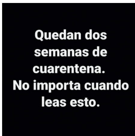
Figura 6 - Memes y gestión de la política sanitaria (duración del ASPO)