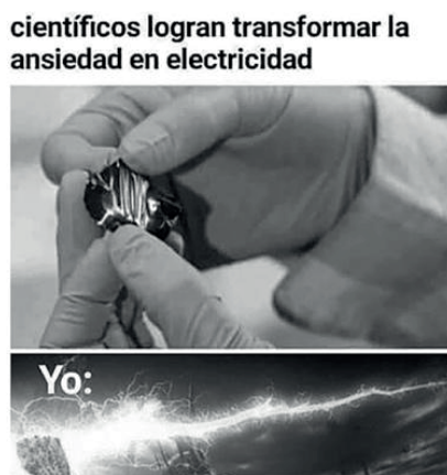
Figura 12 - Memes e impactos en la salud mental