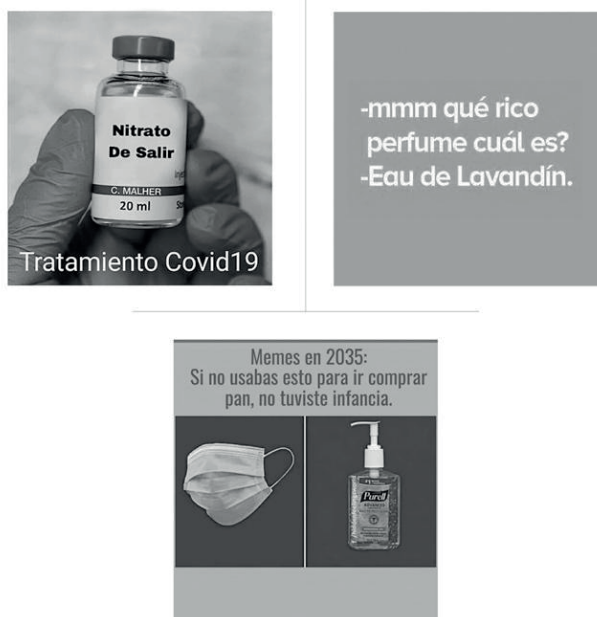
Figura 10 - Memes y prácticas preventivas de la población