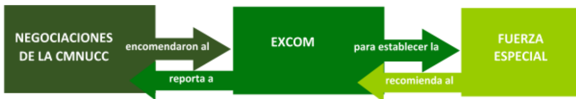
Figura 1: Proceso de formación y de recomendación de la Fuerza Especial de Desplazamiento

La Fuerza Especial finalizó sus recomendaciones al ExCom, el cual las presentó en su reporte a la COP24 de Katowice, involucrando áreas temáticas como: Políticas/Práctica – Nacional/Subnacional; Políticas – Internacional/Regional; Datos y Evaluaciones; Encuadre y conexiones.