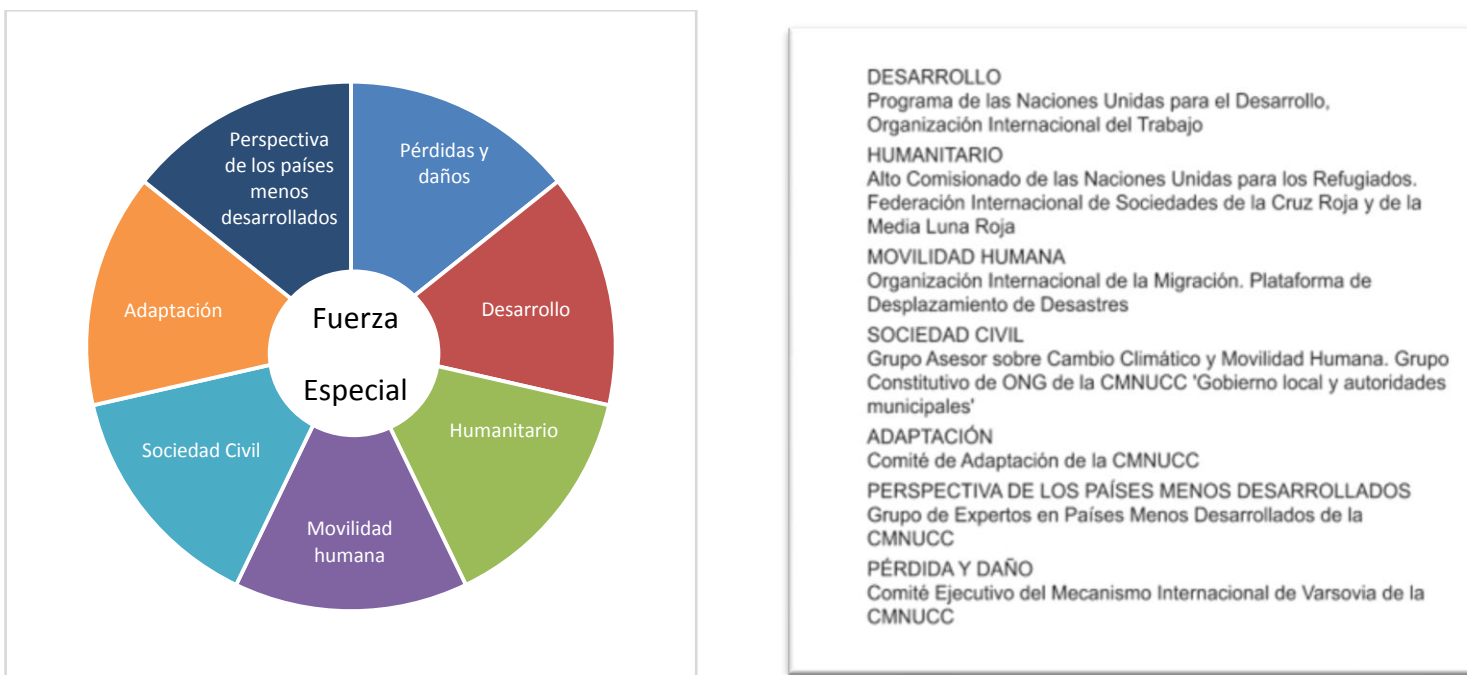
Figura 2: Conformación de la Fuerza Especial de Desplazamiento