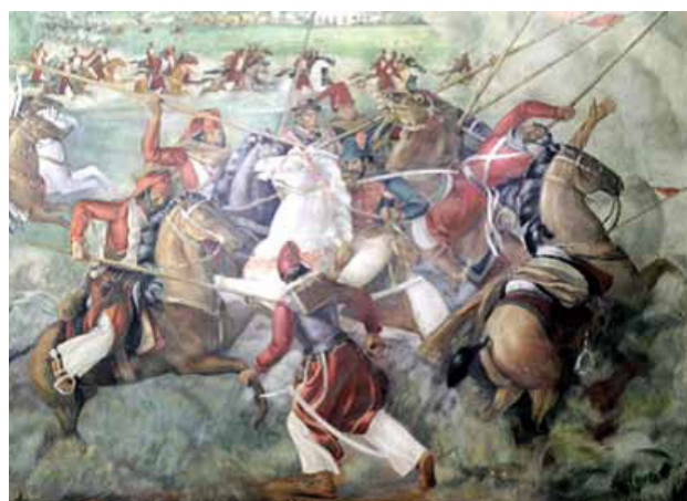
Foto: La Batalla de Caseros Mural 1939 detalle.