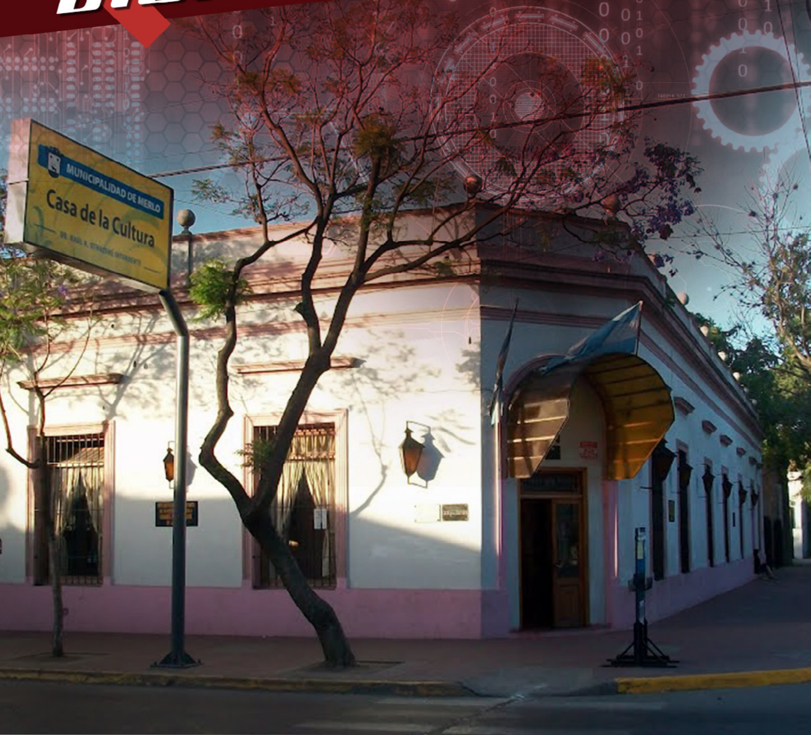
Municipalidad de Merlo "Casa de la Cultura"