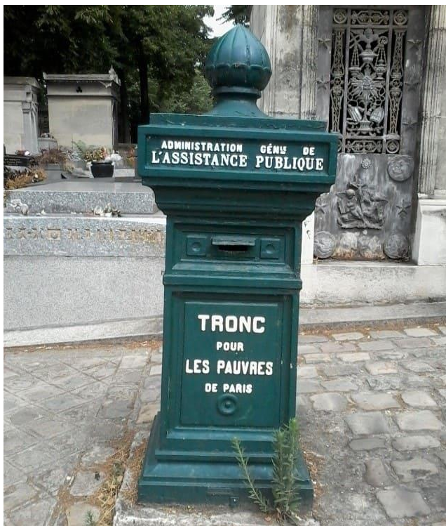
Imagen 2. Buzón para limosnas.