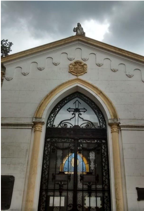
Imagen 8: “Panteón de la Asociación Española de Socorros Mutuos”.

El panteón de la AESM es de tamaño mediano ( 14 \times 9 = 126 \text{ m}^2 ), de estilo neogótico, blanco con detalles en amarillo. Posee una estatua de Jesucristo en el techo, cruces de hierro en las puertas y dos chapas en ambas hojas que versan: “Panteón Español”. Sobre el borde superior de la puerta se encuentra, al igual que en las cuatro paredes, un escudo de Castilla y León. En el interior se observa una placa de mármol, donde se encuentra la piedra fundamental con la inscripción del año 1911 y en el frente, al igual que todos, un espacio para esperar el cajón, con un altar y una cruz, y una inscripción original que versa: “Panteón de la Sociedad Española”. A ambos lados se observan espacios para reducciones o urnas de cenizas, de manera que pueden permanecer de distintas formas bajo el amparo asociativo. A ambos lados de la puerta hay placas conmemorativas que expresan: “Homenaje de la Asociación Española de S. Mutuos en su cincuentenario. Sus presidentes fallecidos 1892-1942” (con la nómina de todos) y “La Sociedad Española de S. M. a sus fundadores y socios fallecidos en su centenario. 1892-1992”.