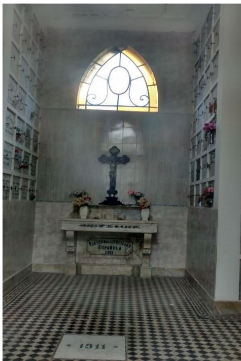
Imagen 9: “Interior del panteón de la AESM”.