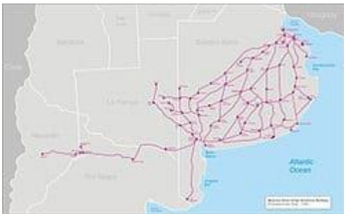
Imagen 6: “Mapa de la red ferroviaria del Sur”.