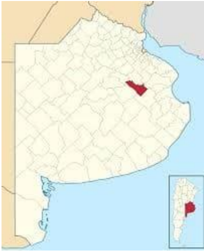
Imagen 5: “Ubicación del partido de General Belgrano”.