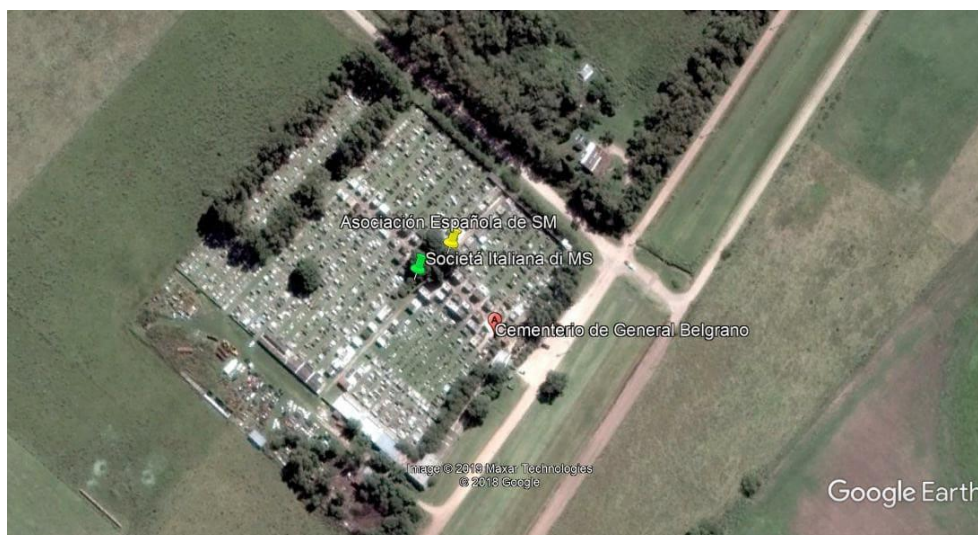
Imagen 7: “Cementerio del partido de General Belgrano”.