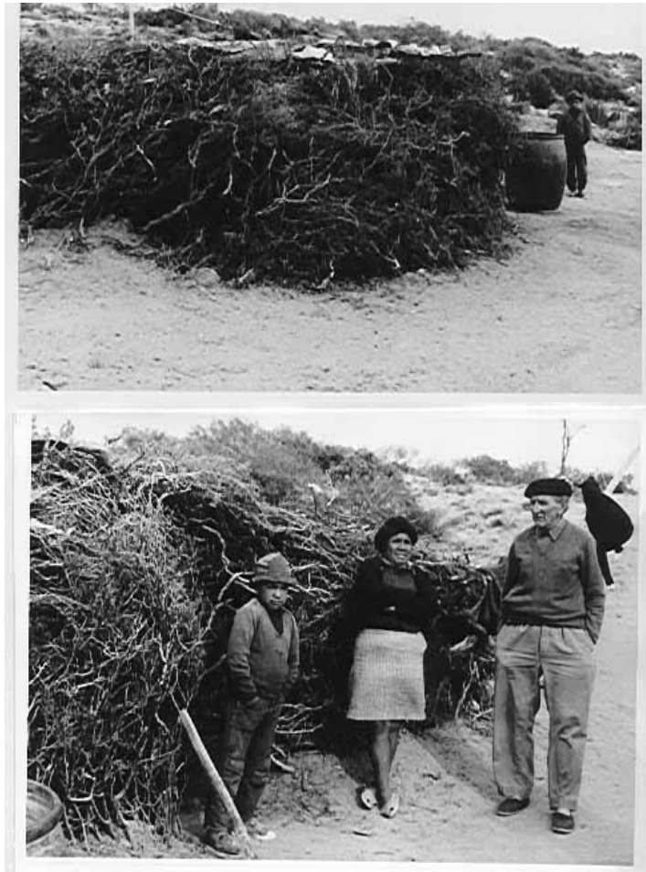
Figura 2. Viviendas de pescadores artesanales en la zona en estudio hacia 1970. Es importante señalar el uso de especies del matorral patagónico para conformar verdaderos "iglúes" del semi-desierto. Este tipo de construcción se utilizaba también para conservar la captura de pulpito, durante un par de días, hasta tanto arribaba el vehículo que transportaba la carga a la zona de venta.