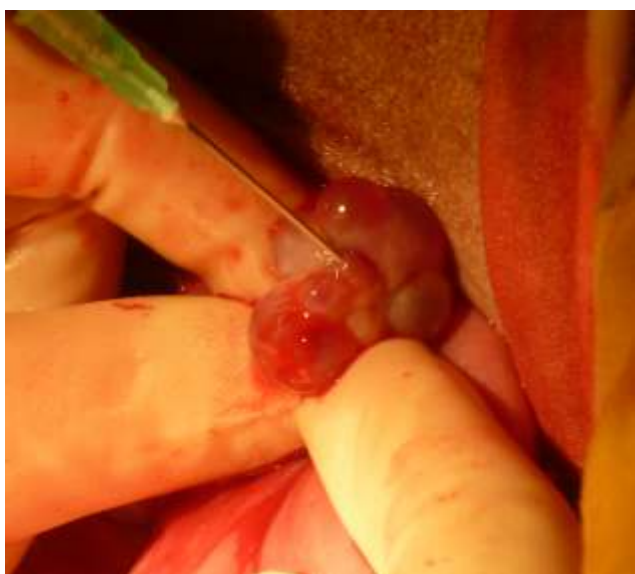
Figura 2. Aspiración folicular vía laparotomía en llama (ARRIBA) y vicuña (ABAJO) luego del tratamiento de superestimulación

La obtención de gametas provenientes de animales vivos ofrece la posibilidad de producir embriones de animales genéticamente superiores. La técnica con mayor porcentaje de recuperación de ovocitos en CSA es la aspiración de folículos vía laparotomía (más del 80%, llama: Trasorras et al. , 2009; alpaca: Gomez et al. , 2002; Ratto et al. , 2007; 55,4% en vicuña: Chaves et al. , 2003) (Figura 2). Otra técnica es la punción vía transvaginal con guía ultrasonográfica pero el porcentaje de COC's recuperados varía entre 52% (Brogliatti et al. , 2000), 74% (Ratto et al. , 2002) y 77% (Berland et al. , 2011) en hembras superestimuladas.