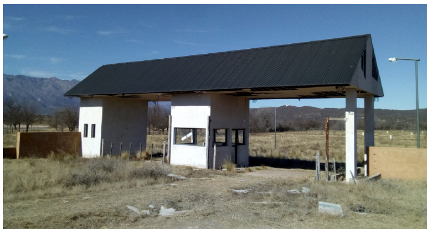
Figura 4. Ingreso abandonado del loteo Cimas de Nono

(...) la demanda de tierras en nuestro Valle de Traslasierra para residencia y para la colocación de inversiones turísticas ha potencializado los negocios inmobiliarios. Los actores sociales de éste sector, en ciertos casos, evalúan la posibilidad de efectuar la conversión de tierras rurales a tierras urbanas, obteniendo una enorme rentabilidad y produciendo expansiones urbanas, a veces, no programadas. (Municipalidad de Nono, 2018, p. 17)