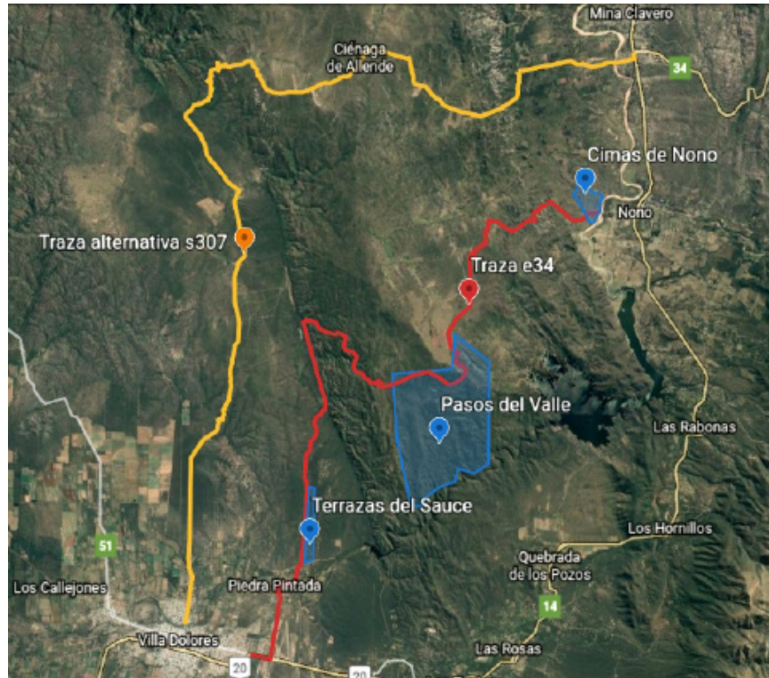
Figura 5. Propuestas para la nueva ruta 34.

que la iniciativa oficial está ligada a la presencia de una serie de emprendimientos inmobiliarios en la zona afectada. Al ya mencionado Cimas de Nono se le sumarían Terrazas del Sauce (cercano a Villa Dolores) y Pasos del Valle, como puntales de un movimiento de valorización inmobiliaria sobre los últimos relictos de vegetación nativa (Retruco, 2019) (figura 5).