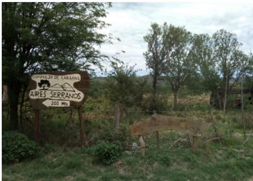
Figura 2. Paraje Bajo el Molino. Terrenos en desuso y avance de la actividad turística

ideas, de encuentro de lo diverso, de gestación de lo híbrido y lo novedoso. En estas localidades, donde convergen trayectorias individuales y colectivas de origen muy diverso, y donde confrontan (con sus matices) formas antitéticas de apropiación de la naturaleza, se conforman situaciones de frontera (Trivi, 2014). Se trata de escenarios de disputa entre territorialidades contrapuestas por recursos y espacios de decisión, donde los sujetos (individuales y colectivos) apelan a su acervo de estrategias para tejer alianzas de duración y objetivos variables, en los que tiene un peso determinante la identificación alrededor de la pertenencia al lugar. De allí la distinción entre nativos y foráneos, vehículo para el choque de intereses, pero también para la elaboración paciente de nuevas realidades políticas.