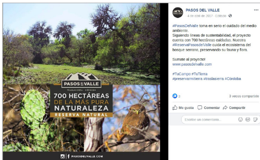
Figura 6. Material de promoción de Pasos del Valle

serrano, acceso rápido a localidades cercanas, son algunos de sus tópicos recurrentes en un lenguaje visual y sensorial común a la promoción turística. La realización de actividades de esparcimiento como trekking , cabalgatas, degustaciones y hasta la presencia de un vivero de especies autóctonas, son integradas al conjunto de estrategias publicitarias del emprendimiento. En consecuencia, el contacto y respeto por la naturaleza que se garantizaría en el predio se vuelve un activo para sus ocupantes y un factor de valorización para sus inversores (figura 6).