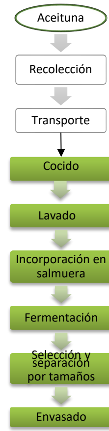
Figura 1. Diagrama de flujo de las operaciones para elaborar aceitunas verdes de mesa

En la elaboración de aceitunas verdes (Figura 1), los frutos son tratados con una solución de hidróxido de sodio (Cocido), lo que provoca un aumento en la permeabilidad de la piel, modifica la estructura celular, reduce la textura, produce la hidrólisis de la oleuropeína (eliminando el amargor propio del fruto) y disuelve una proporción considerable de azúcares y minerales ( Sánchez Gómez et al., 2000 ). Luego de este proceso, los frutos se lavan para eliminar la mayor parte del hidróxido de sodio, y finalmente se colocan en salmuera de concentración variable en cloruro de sodio. En este tipo de preparaciones, la fermentación característica es láctica y transcurre a expensas de la población microbiana proveniente del fruto ( Hurtado et al., 2010 ). En relación al proceso, es conveniente resaltar que existen diferencias tanto del régimen climático como de la infraestructura y prácticas locales en relación a las de países mediterráneos ( Hurtado et al., 2012 ).