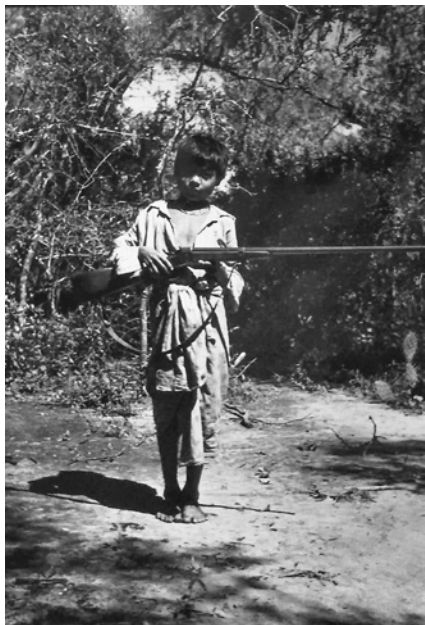
1. «Niño pilagá con fusil», Laguna de los Pájaros, 1939.