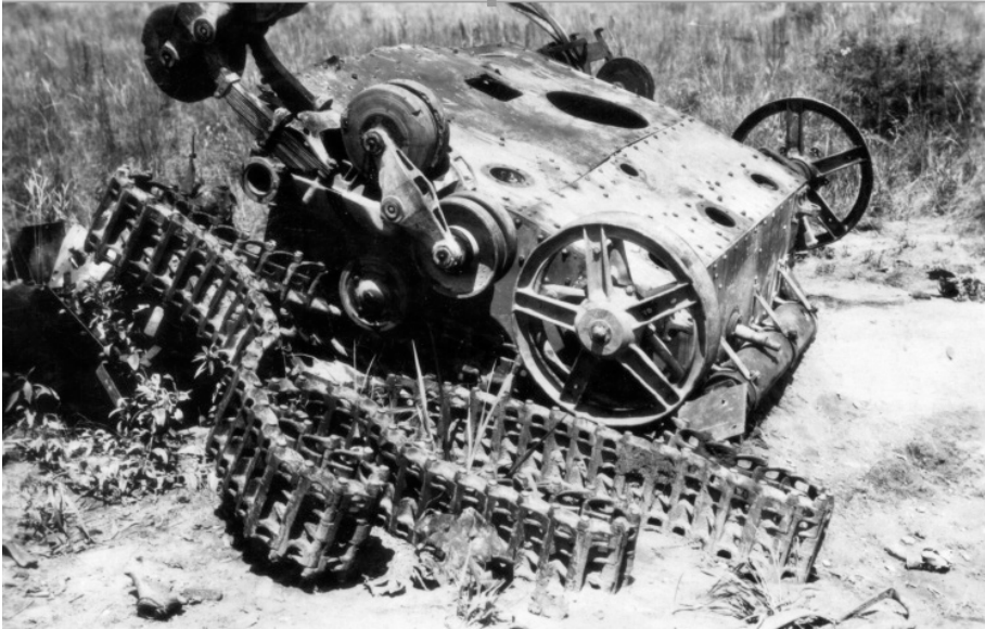
4. Fotografía sin título de Adolfo María Friedrich.

Al mismo tiempo, tal como recalcan los propios testimonios y las acciones indígenas –y en particular el episodio de los nivaclés cruzando el río armados hasta los dientes para apoyar a los pilagás–, resulta innegable que la propiedad de las armas fortalece su capacidad colectiva para lidiar en pie de igualdad con los diversos actores regionales, e incluso incentiva de forma inusitada la identidad regional de unos «hermanos indígenas» que, por primera vez, logran oponerse en un bloque más o menos homogéneo al avance aparentemente incontenible de la colonización.