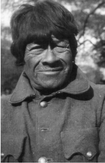
3 “Presidente”, indígena pilagá, sin fecha.

Para entonces el comisario había puesto su pie en el estribo del camión. «Un poquitito de paciencia, señor comisario, y le conseguiré algunos rifles», le dije. Pero tenía poca esperanza.