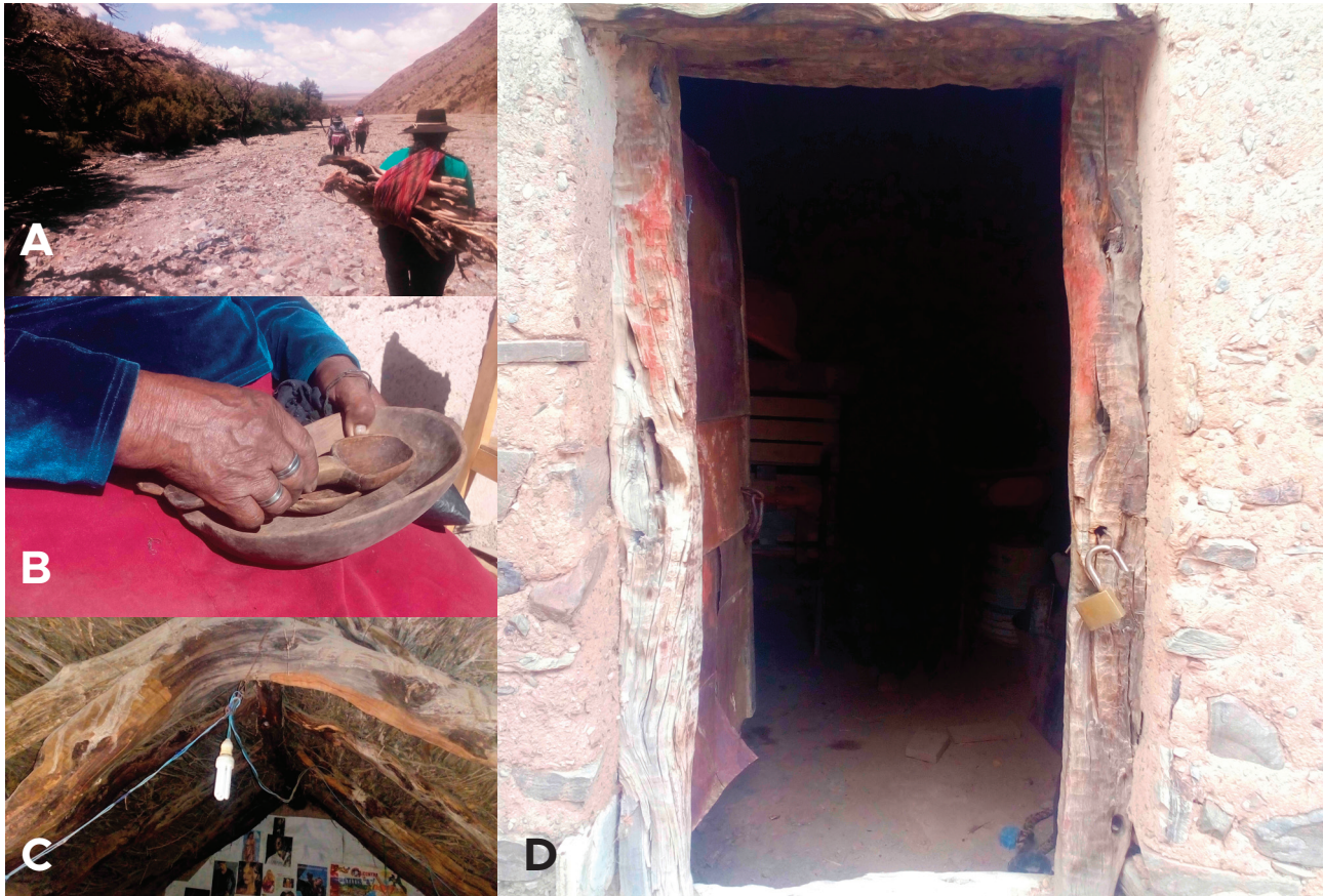
Figura 2. Diversos usos de la madera de “Queuñas” por parte de la comunidad aborígen de Quebraleña: A) Recolección de madera caída para su uso como leña y carbón, B) Elaboración de platos y cucharas, C) Tirantes para la construcción de techos de las casas, D) Marcos de puertas.

“Quebraleñista señores No voy a decir que no Entre medio los queñuales Ahí mismo vivo yo”