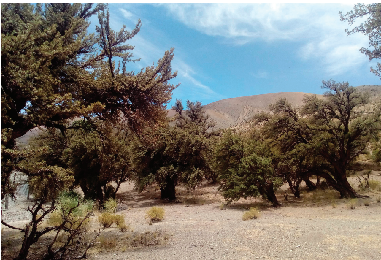
Figura 3. Bosques de “Queuñas” de la localidad de Quebraleña.

Tanto la minería como las políticas gubernamentales son identificadas como peligros asociados a la desaparición de las “Queuñas”, la conservación de los bosques, la cultura y el patrimonio de la comunidad. “ También el peligro que corren por la presencia de Minera El Aguilar, los gobiernos que están a favor de la minería, con solo la presencia de Minera el Aguilar, los bosques han ido desapareciendo por falta de agua y además hoy en día