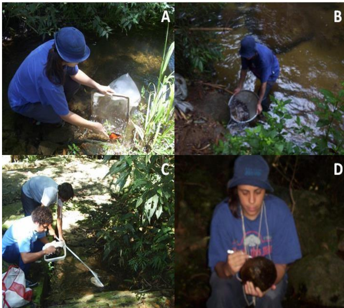
Figura 4. Métodos de amostragem: (A) amostrador do tipo Surber; (B) peneira; (C) rede triangular e; (D) manual.