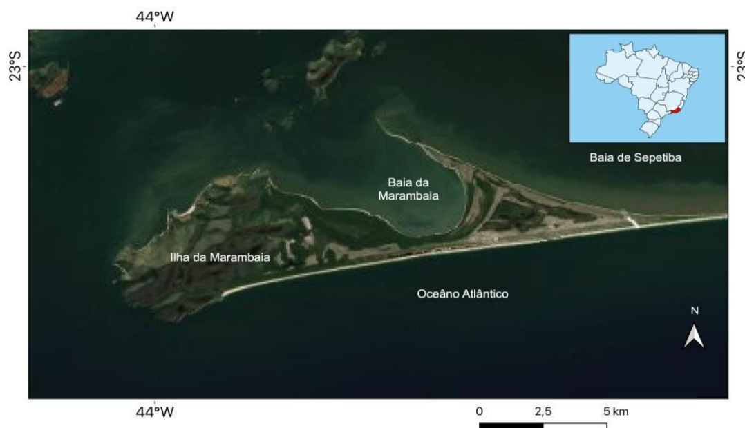
Figura 1. Ilha da Marambaia, Mangaratiba, Rio de Janeiro, Brasil.

As amostragens foram realizadas durante expedições mensais, ao longo de dois anos (setembro de 2003 a agosto de 2005), num trecho de 1 km no Rio Marambaia, com altitude variando entre 0,5 e 150 m ( 23^{\circ} 03' 39''S ; 43^{\circ} 58' 34''W e 23^{\circ} 03' 63''S ; 43^{\circ} 58' 73''W ) (Figura 2).