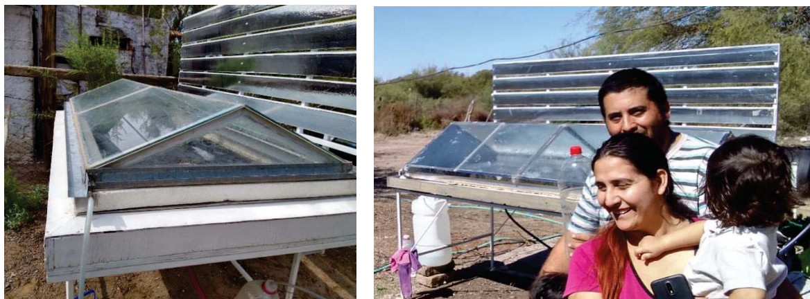
Figura 4: destilador solar de batea y la familia que recibe el destilador.

Por otro lado, tomando en cuenta la tecnología disponible en el INAHE, fruto de investigaciones previas (Esteves et al., 2009; Esteves et al., 2015) se construyeron dos destiladores solares que permiten con un funcionamiento muy sencillo, tomar en cuenta la potabilización del agua disponible en los puestos. Al destilar el agua, los contenidos salinos se reducen casi totalmente, pasando de un agua de unos 4000 \mu\text{S}/\text{cm} de conductividad eléctrica a agua destilada con <17 \mu\text{S}/\text{cm} (Esteves et al., 2013).