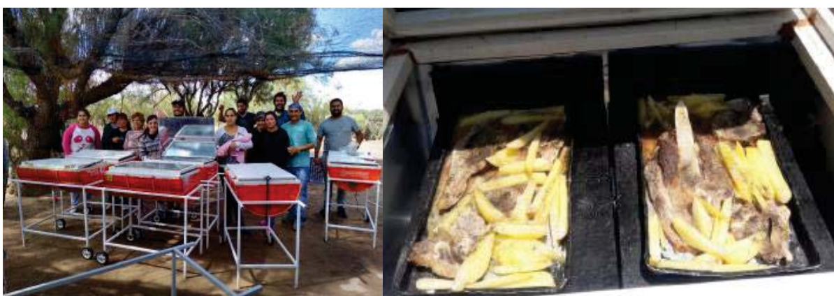
Figura 3: Foto del taller de armado de hornos solares y demostración de cocciones posibles.

El segundo paso fue diseñar y construir las huertas familiares. Para esto, se comenzó con la preparación de tierra fértil, preparación de plantines y además con armado de cierre de tela romboidal por los laterales y colocación de tela antigranizo para evitar no sólo la acción del granizo, sino también la incursión de aves (especialmente catas) que atacan la producción. Cabe aclarar que cada infraestructura se realizó teniendo en cuenta las condiciones particulares de cada puesto y la cantidad de recursos disponibles. Así, por ejemplo, se diseñaron huertas de mayor tamaño para familias que cuentan con posibilidades de invertir más tiempo en el cuidado de canteros sembrados.