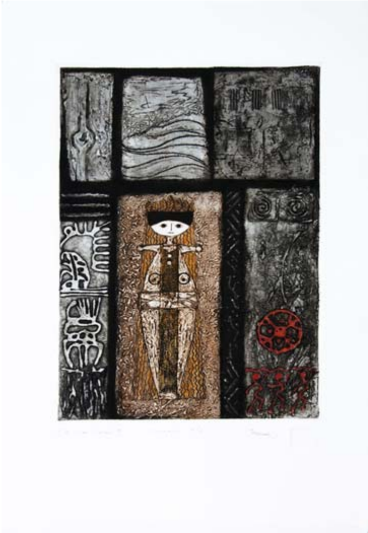
Serie Las Diosas , collagraph. Marta Arangoa