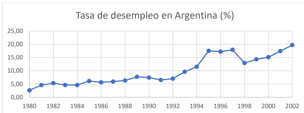
Gráfico 2. Tasa de desempleo en Argentina por años.

El carácter compensatorio de la ESA y la hegemonía del enfoque laboral sobre la formación integral del adulto tienen su fundamentación en el contexto económico y laboral de la década del 90, principalmente sobre el crecimiento del desempleo (Gráfico 2). La Ley de Reforma del Estado N°23.696 (D12) autoriza al presidente a proceder con la privatización de un gran número de empresas estatales y a la fusión y disolución de diversos entes públicos. Esto trajo consigo una ola de despidos en masa y de los llamados retiros voluntarios en la administración pública, que fueron entendidos como despidos encubiertos. Así, desde 1991, la tasa de desempleo en Argentina fue en ascenso hasta alcanzar su máximo relativo del 18% en 1997.