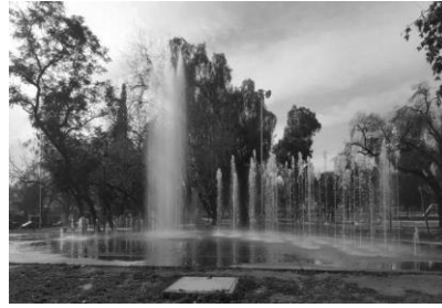
Figura 4. Fuente de agua

El factor suelo se ve impactado intensamente por las actividades llevadas a cabo en el parque. El cambio de uso del mismo para agregar un skatepark, una pista de park-our, ciclovías y senderos, ocuparon un extenso sector del parque de manera irreversible. Este impacto se puede mitigar levemente y a largo plazo con el aumento de la densidad vegetativa y el óptimo manejo de la vegetación reforestada. Además, como se puede comprobar en las mediciones de temperatura realizadas en el entorno, sobre el área cementada se percibe un efecto directo sobre el aumento de la temperatura superficial (Tabla 2). Se observa que la disminución de cobertura vegetal debido a la erradicación o tala de árboles tiene un efecto directo y sinérgico sobre el suelo, al disminuir la cantidad de especies arbóreas y arbustivas se disminuye la permeabilidad del suelo y su capacidad de retener humedad. Lo que puede generar mayor escorrentía y erosión del suelo. La incorporación de juegos para niños, máquinas para hacer ejercicio, pistas de actividades recreativas y reacondicionamiento del parque, aumentan la concurrencia de la población, lo cual genera mayor cantidad de residuos depositados en el mismo y en acequias. Si bien este impacto es leve, si no se aplican medidas preventivas y de concientización, tiene un efecto acumulativo alto, aunque fácilmente remediable.