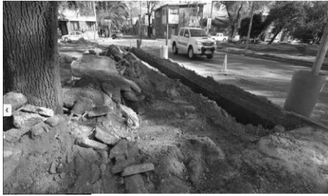
Figura 3. Remodelación de acequias.