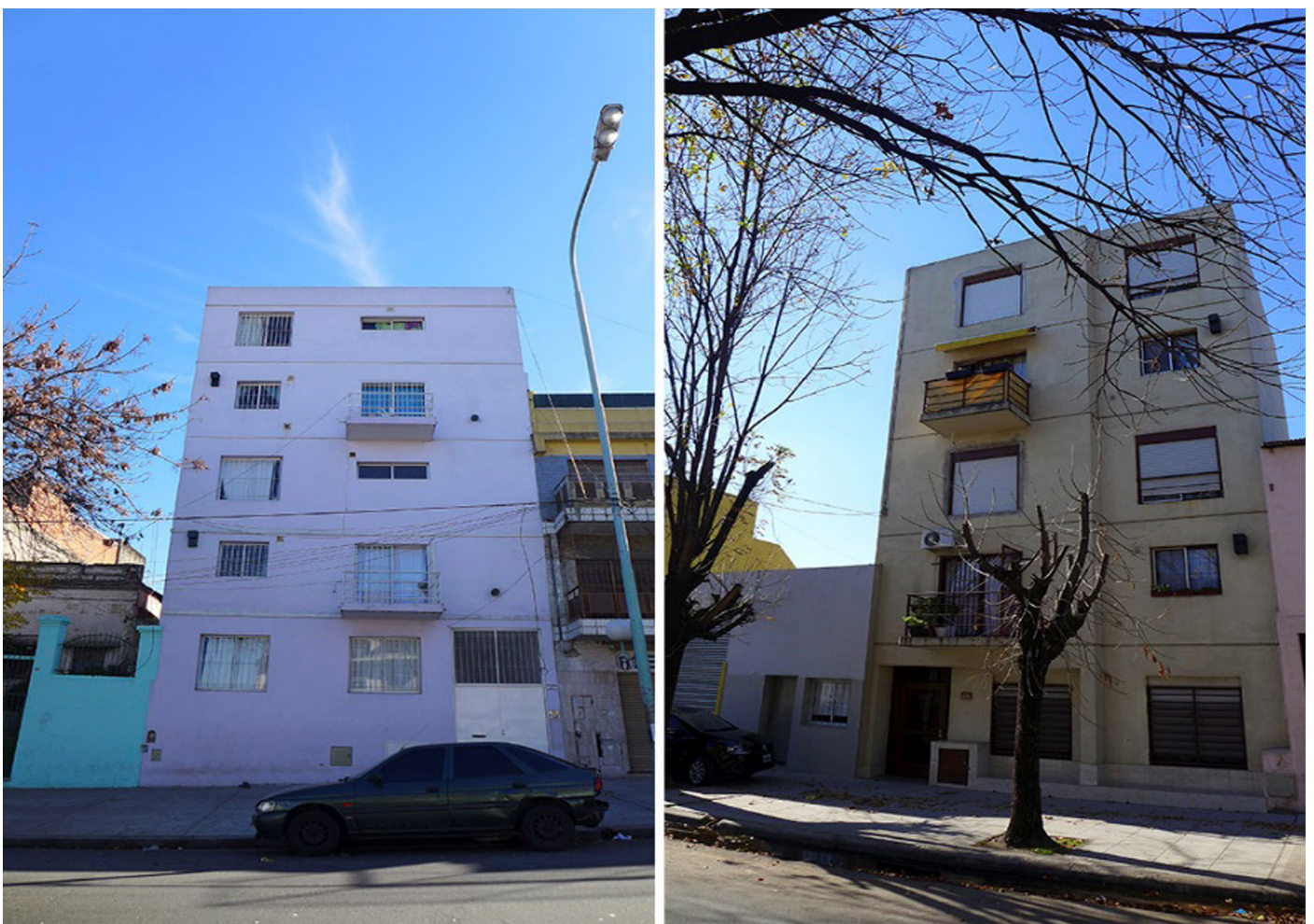
Figura 3: Cooperativa 18 de junio y Cooperativa Luz y Progreso.

En relación a este último aspecto, dentro de las experiencias autogestionadas analizadas se detectaron dos cooperativas constructiva y estéticamente casi similares, verificándose una “participación omitida” (De la Mora, 1992) por parte de sus destinatarios en el diseño de las viviendas. Al consultar en las entrevistas sobre las características que asumió la etapa de diseño de las viviendas, se detectó que ambas cooperativas compartían profesionales del ETI y fundamentalmente, arquitecto. Al indagar en las modalidades de trabajo se detectó que los espacios de participación generados para el diseño de sus casas, en ambas cooperativas, se limitaron a encuentros informativos sobre las características que tomaría el proyecto constructivo, en donde no se habilitaron instancias para la introducción de modificaciones estructurales al pro-