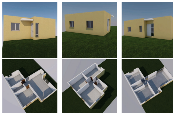
Figura 2. Prototipo A-12. Figura 3. Prototipo A-13. Figura 4. Prototipo B-13.

Blasco Gutiérrez, Parant, Olivier, González Redondo y García (2017) manifiestan que la metodología BIM constituye una evolución del trabajo colaborativo en todas las partes de un proyecto y, por ende, la enseñanza universitaria se debe adaptar al actual perfil digital del alumno a partir de