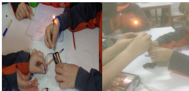
FIGURA 5. Fotografías de los estudiantes manipulando fuentes de corriente continua, lámparas led y sus respectivas representaciones en sus cuadernos.

Sintetizamos los conceptos abordados en las distintas situaciones en la tabla I.