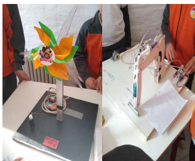
FIGURA 2. Algunos de los inventos realizados por los estudiantes.

Además, algunos estudiantes se sintieron tan motivados que, si bien no era lo esperado, además inventaron algunos pequeños y sencillos artefactos en los cuales se transforma la energía mecánica en eléctrica, como se muestra en la figura 2.