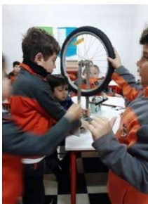
FIGURA 4. Los estudiantes generando corriente eléctrica a partir de un dínamo construido con una rueda de bicicleta, en una clase compartida del docente de aula y la profesora de Ciencias de la Computación.

El momento clave del aprendizaje del concepto de inducción electromagnética se produjo cuando los estudiantes construyeron un dínamo en el aula, a partir del movimiento de una rueda de bicicleta, como se muestra en la fotografía de la figura 4. En este momento fue notorio el entusiasmo de los estudiantes para la construcción y los intentos de explicar su funcionamiento.