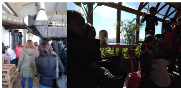
FIGURA 3. Izquierda: Fotografía de los estudiantes y docentes en la usina de electricidad de la ciudad de Tandil. Derecha: los estudiantes conversando con el diseñador y constructor de la casa autosustentable.

Luego se realizó la visita a «La Osera de la Sierra» dentro de un espacio sustentable, diseñado y construido con materiales naturales, donde pudieron conocer acerca de la obtención de energía a través del sol y el aprovechamiento eficiente del agua. En ese contexto los estudiantes realizaron numerosas e interesantes preguntas relativas a la generación de electricidad sin depender de la Usina, que fueron respondidas por su diseñador y constructor. La figura 3 muestra fotografías capturaron dos instantes de ambas salidas: