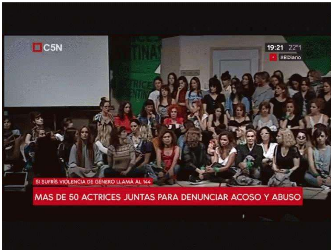
Figura N° 1. Captura de pantalla de la cobertura en vivo de la conferencia de prensa del Colectivo Actrices Argentinas, Ciudad Autónoma de Buenos Aires. Video difundido por C5N en su cuenta de Youtube el 11 de diciembre de 2018.