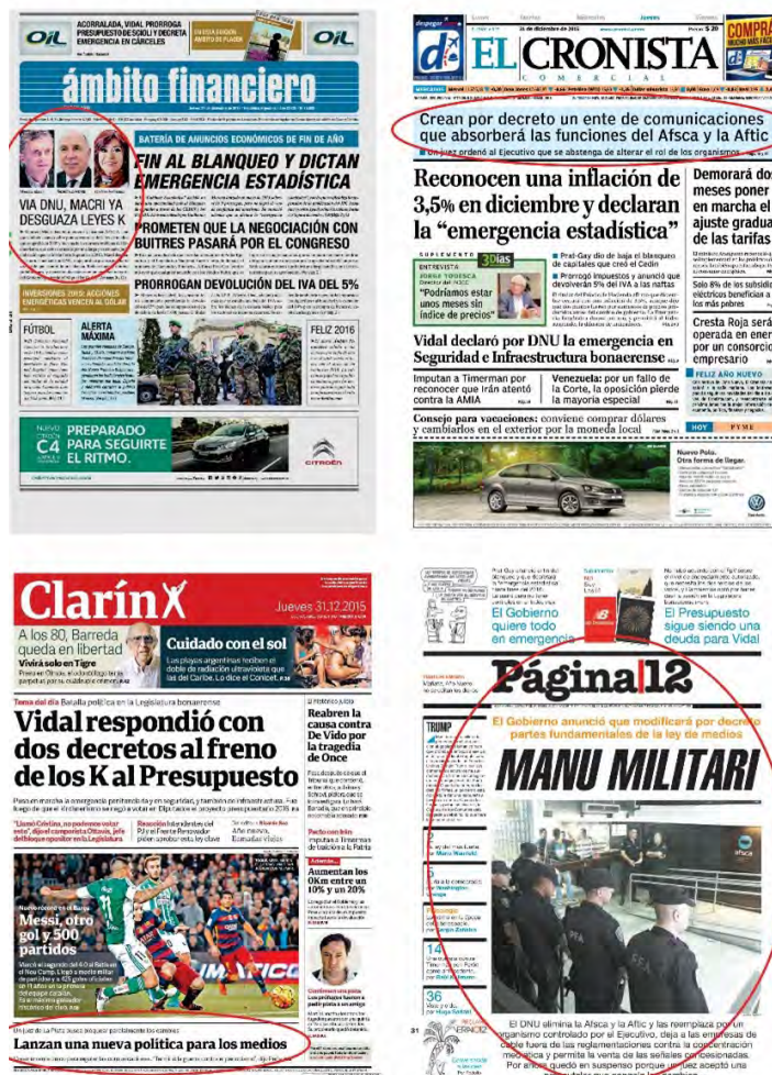
Figura 2. Portadas del 31 de diciembre de 2015