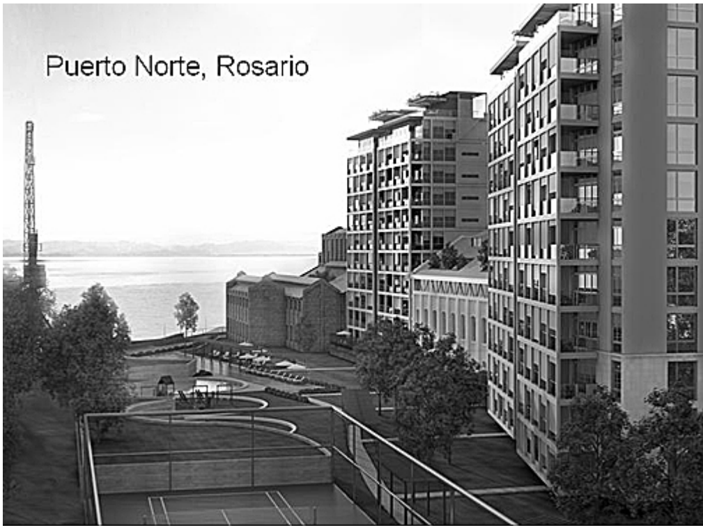
Figura 3 – Puerto Norte