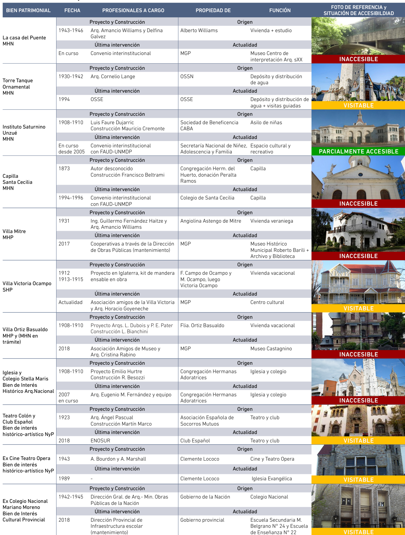
Cuadro 1. Bienes relevados y situación de accesibilidad.