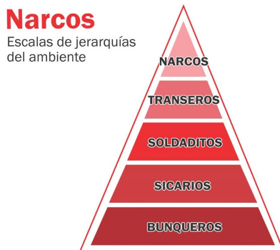
Imagen 1: Jerarquías ligadas al mercado de drogas ilegalizadas a nivel local

Por otro lado, y ligado al punto anterior, este modo de comercialización a mayor escala implicó una división del trabajo más compleja y sofisticada, generando diversos y novedosos puestos al interior de ese mercado, creando nuevas alternativas para los jóvenes del barrio, aunque subordinada y muy mal paga. Participación subordinada que no se distancia demasiado de las características de participación de los jóvenes en el mercado de trabajo legal formal e informal, tal como señalan una serie de estudios en la región. Es decir, el tipo de empleo al que acceden en general son los más precarios, de menos ingresos y en donde abundan las relaciones informales (BENASSI, 2017; KESSLER, 2013). Asimismo, estas nuevas alternativas se tradujeron y/o impactaron en nuevas jerarquías en el mundo del delito local: narcos , transeros , sicarios , soldaditos y bunqueros , y, al lado, las tradicionales en relación a los ladrones: ladrones de caño y rastreros 21 .