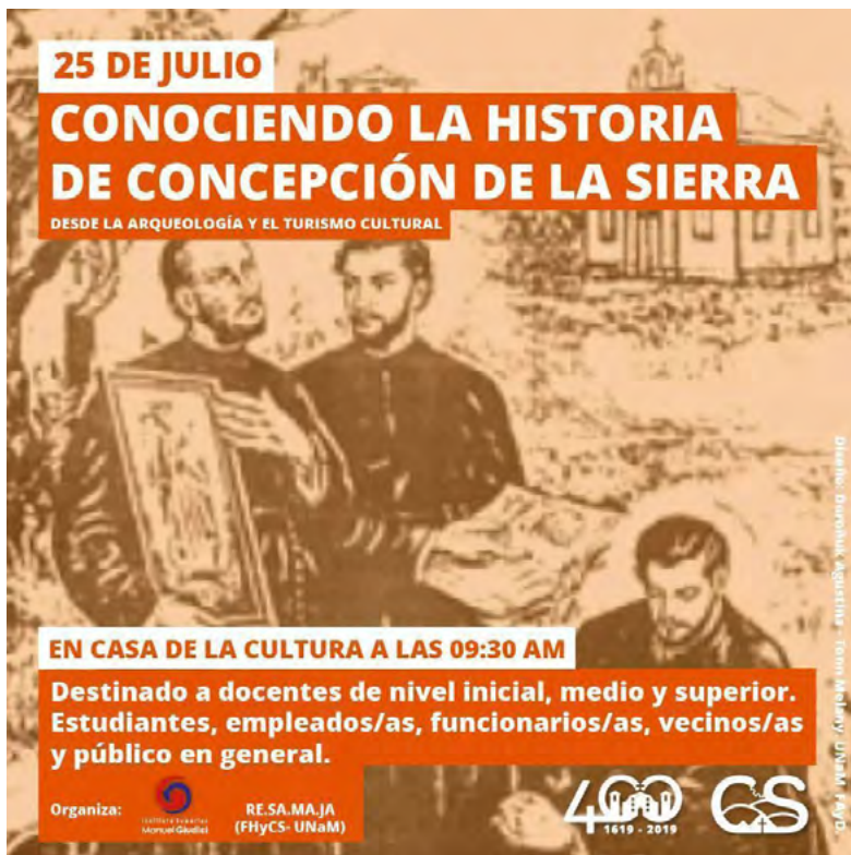
Figura 4. Invitación de charla “Conociendo la Historia de Concepción de la Sierra”. Miradas desde la Arqueología y el Turismo Cultural.

El taller realizado tuvo una respuesta positiva tanto en los niños y niñas que asistieron como en las docentes que ayudaron en todo momento en la organización. De esta manera, un determinado público accedió a cuestiones básicas sobre la arqueología por primera vez a partir del juego y la recreación del trabajo de un arqueólogo/a ( figura 5 ).