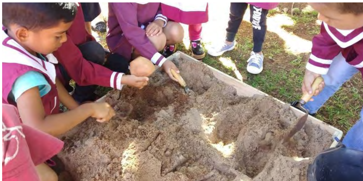
Figura 5. Taller de Arqueología para niños/as.