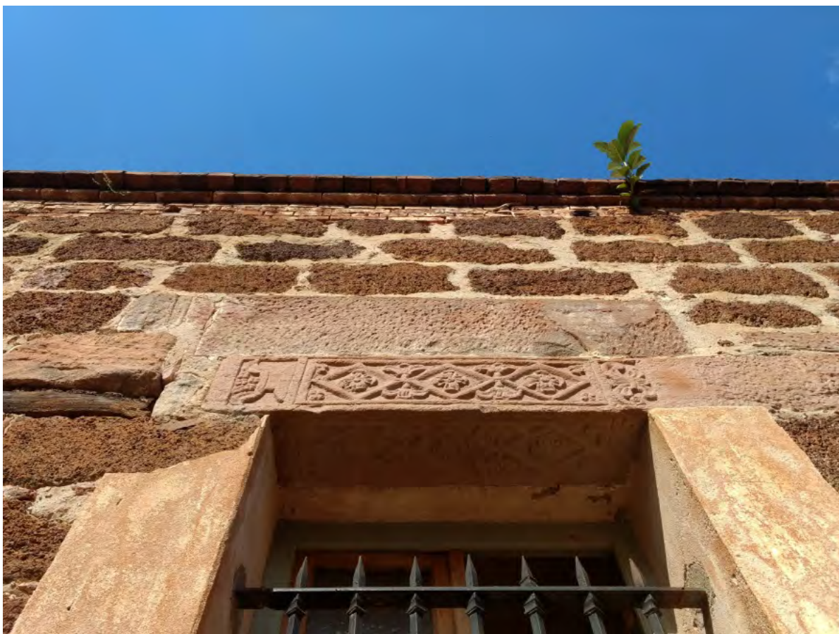
Figura 3. Dintel puesto en la parte superior de una ventana en la fachada del cabildo.