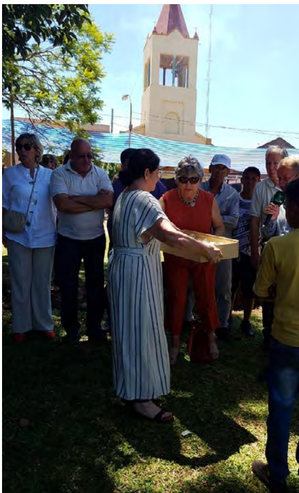
Figura 6. Foto: restitución de talla jesuítica durante el acto central de los festejos por los 400 años de Concepción de la Sierra.

Finalmente, en horas de la tarde, se celebró, con presencia del gobernador y autoridades provinciales, escuelas y pueblo en general, el acto en conmemoración por el 400 aniversario y en Homenaje a Andrés Guacuarí. En este acto, se realizó la inauguración del cabildo y se leyó su declaración de patrimonio histórico provincial.