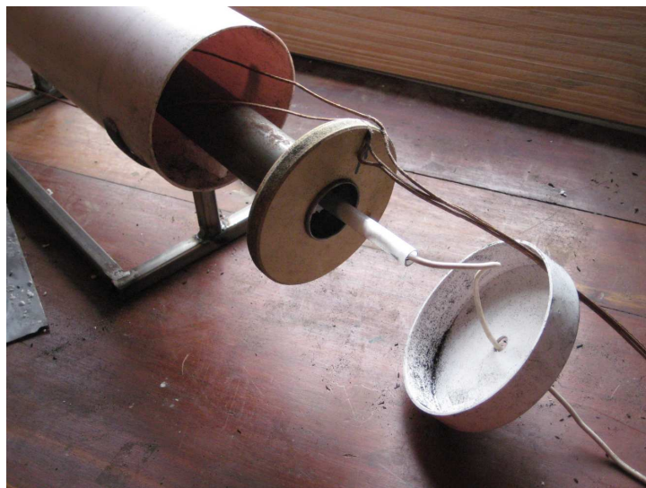
Fig. 3.- Muestra el equipo semidesarmado. Se ve el caño metálico interno, El tubo de cuarzo, las maderas de centrado, las termocuplas, el caño externo, la tapa y el cable de conexión a la resistencia.

La resistencia de calentamiento es una cinta de Alferón con una resistencia de 2 Ohms. El Alferón es una aleación de hierro, cromo y aluminio de la familia del Kanthal. Es usada en resistencias de calentamiento soportando 1500 C. El valor elegido para la resistencia permite utilizar una fuente DC de bajo voltaje, menor a 30 V, y corrientes hasta 3 A.