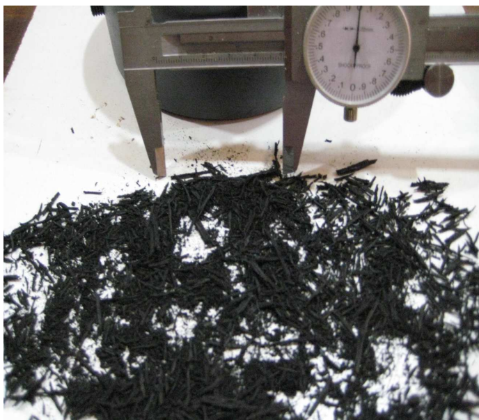
Fig. 1.- Muestra el material obtenido con la molienda. El nonio indica los 5 cm.

Los neumáticos usados de vehículos constituyen hoy día un residuo contaminante de gran entidad dada la cantidad de vehículos que circulan actualmente. La recuperación es limitada y no resulta sencillo encontrar un uso sustitutivo de los mismos debido a su forma especial y la alta resistencia del material (goma vulcanizada). Algunos empresarios han pensado