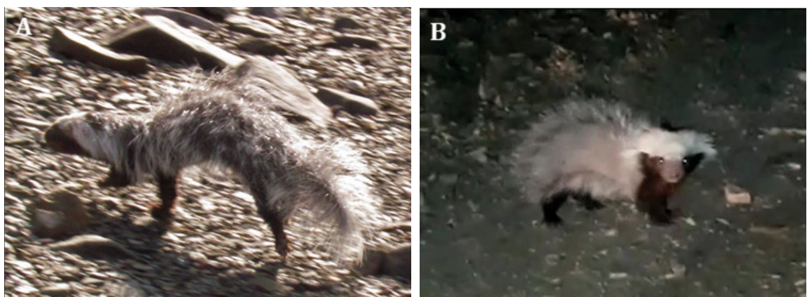
Figura 1. Individuos de Lyncodon patagonicus reportados en este trabajo: A) individuo registrado frente a la mina de Gualilán (17 de mayo de 2018 a las 16:27 h); B) uno de los cuatro individuos registrados al norte de la Reserva Don Carmelo (13 de agosto de 2020).