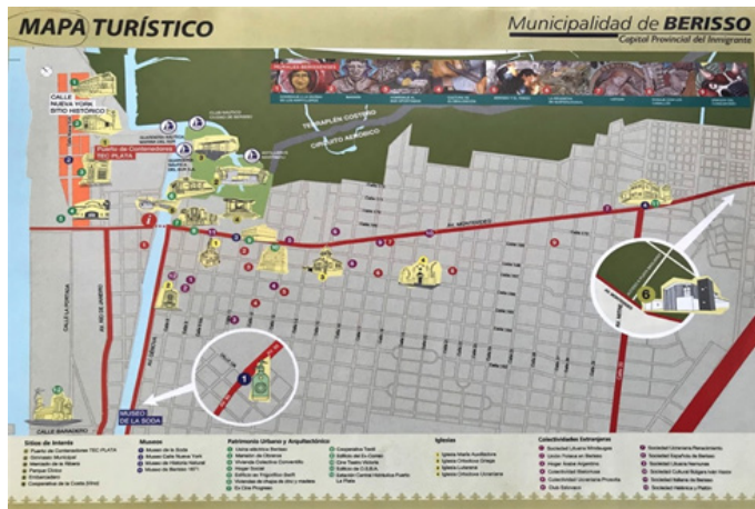
Mapa, Gacetilla Oficial, 2014.