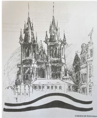
Dibujo, Gaceta Oficial, 2002.