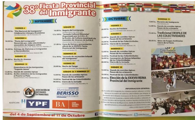
Cronograma de actividades, Gacetilla Oficial, 2015.