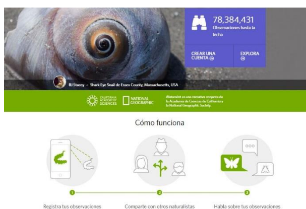
Imagen de la página de inicio de la plataforma iNaturalist indicando brevemente cómo funciona.

hongos, incluyendo macro y microorganismos. Las observaciones incluyen fotografías de los organismos y/o grabaciones de sonidos (como la vocalización de aves, por ejemplo). Además, la plataforma iNaturalist es de carácter integrador y posibilita la asociación con instituciones locales, por medio de la Red iNaturalist.