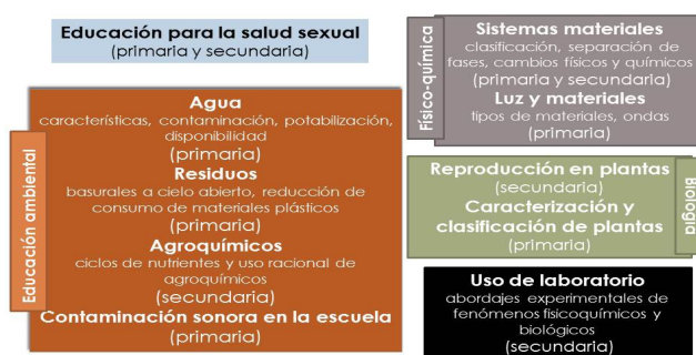
Figura 1. Temáticas elegidas por las/os docentes para elaborar sus propuestas didácticas.

Como resultado del trabajo, se formaron 15 grupos docentes que diseñaron e implementaron propuestas (Figura 1) que abarcaron las áreas de Educación Ambiental; para la Salud Sexual; Física y Físico-química; Biología; y uso del laboratorio para abordajes experimentales de fenómenos fisicoquímicos y biológicos. En las JIPE se presentaron, entre otros, los análisis de las innovaciones realizados por 5 de estos grupos, luego recopilados en un libro de autoría colectiva (Dumrauf, Cordero y Mengascini 2013).