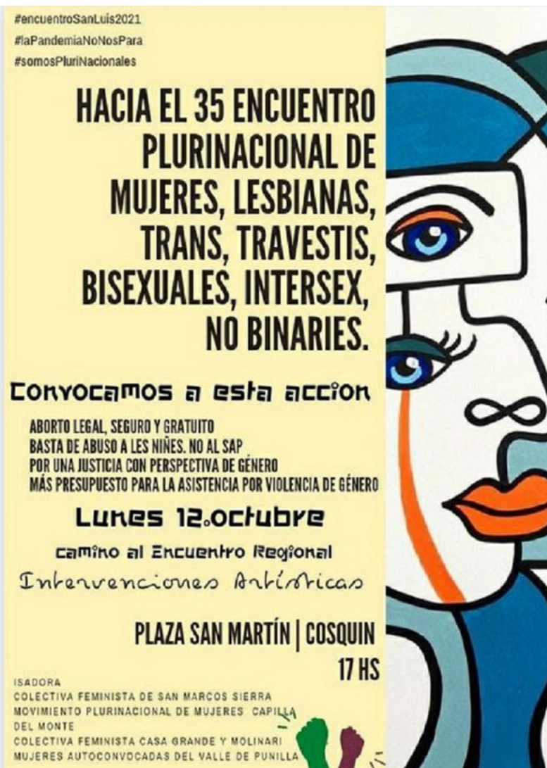
Imagen 7: (2020, octubre). Cartelería. Flyer para difusión impresa y digital de la convocatoria del 12/10/2020 en el marco de las luchas feministas y a causa de la suspensión del Encuentro Plurinacional de MLTTINB por covid-19.

integrantes de las colectivas de Molinari y Casa Grande 8 . Las placas fueron realizadas con arcillas cosechadas en los respectivos territorios puni-