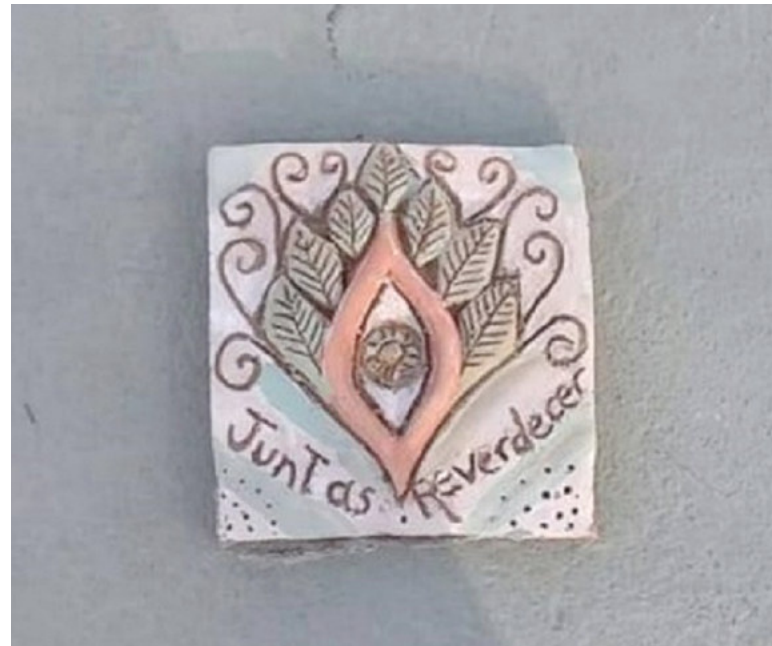
Imagen 10: (2020, octubre). Juntas Reverdecer [cerámica]. Cosquín, Argentina. Fotografía de las intervenciones del 12/10/2020 en la Plaza San Martín.

de barro” 26 . La puesta del cuerpo se presenta, en las formas propias en que se sostiene en el valle, a través de procesos de construcción familiar como práctica colaborativa, como estrategia y alternativa económica (ante propuestas inmobiliarias y de solución de hábitat de alto impacto ecológico) de sectores sociales que se mantienen a través de proyectos cooperativos, artísticos e independientes. Desde múltiples situaciones se promueven, a través de las interacciones y yuxtaposiciones de sentido que habilita el uso variado de un material en un contexto específico, discursivas políticas y propuestas contrahegemónicas ante los estragos del poder y el capital en los contextos serranos. Se habilita, desde variadas posiciones, un sentido del territorio como “parte”, no como usufructo o “paisaje” de fondo donde se