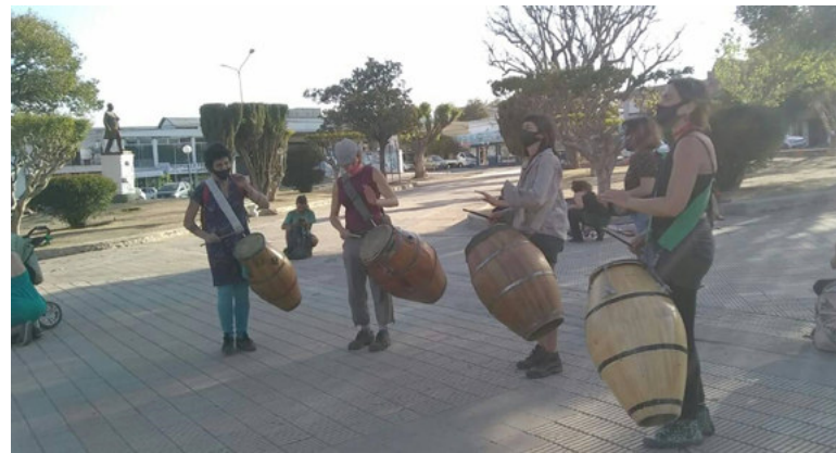
Imagen 2: (2020, 12 de octubre). Candombeada . Plaza San Martín. Cosquín, Argentina.

taron 5 desde variadas poblaciones punillanas por “fuera” del circuito considerado “céntrico” para la lógica urbano-turística que caracteriza a los mencionados territorios.