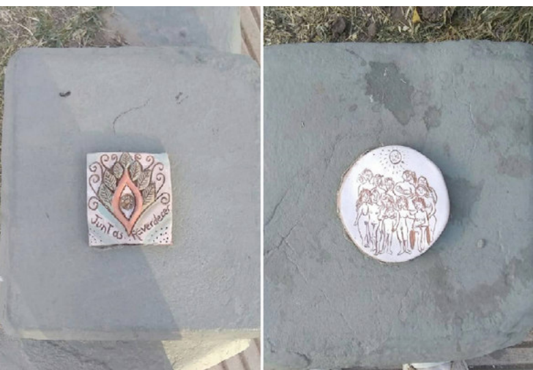
Imágenes 8 y 9: (2020, octubre). Placas cerámicas. Cosquín, Argentina. Técnica cerámica. Fotografía de las intervenciones del 12/10/2020 en la Plaza San Martín.

de barro” 26 . La puesta del cuerpo se presenta, en las formas propias en que se sostiene en el valle, a través de procesos de construcción familiar como práctica colaborativa, como estrategia y alternativa económica (ante propuestas inmobiliarias y de solución de hábitat de alto impacto ecológico) de sectores sociales que se mantienen a través de proyectos cooperativos, artísticos e independientes. Desde múltiples situaciones se promueven, a través de las interacciones y yuxtaposiciones de sentido que habilita el uso variado de un material en un contexto específico, discursivas políticas y propuestas contrahegemónicas ante los estragos del poder y el capital en los contextos serranos. Se habilita, desde variadas posiciones, un sentido del territorio como “parte”, no como usufructo o “paisaje” de fondo donde se