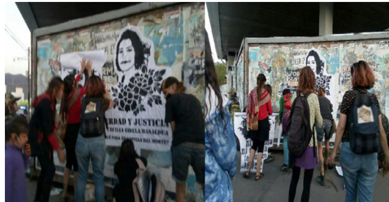
Imagen 6: (2020, 12 de octubre). Colocación de Pegatinas. Cosquín, Argentina. Realizada en el marco de las intervenciones alrededor de la Plaza San Martín y en el marco de la lucha por el esclarecimiento del femicidio de Cecilia Basaldúa.