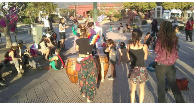
Imagen 1: (2020, 12 de octubre). Encuentro . Plaza San Martín. Cosquín, Argentina.

Por medio de la difusión en redes sociales y medios de comunicación locales, concurren a la convocatoria para realizar las intervenciones, referentes y particulares desde todo el valle punillano y desde la ciudad de Córdoba. Si bien estas fueron planificadas para realizarse en simultaneidad durante el 12 de octubre en diferentes centros poblacionales del valle, únicamente se concretaron en la ciudad de Cosquín. No obstante, se pensaron, produjeron y proyec-