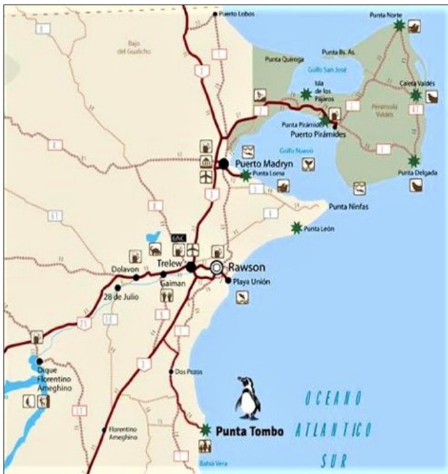
Comarca Virch-Valdés, Chubut, Patagonia Argentina