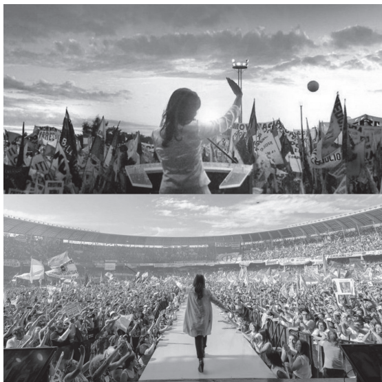
Figura 1. Cristina y las multitudes. Fuente: Elaboración propia con base en Blog No me quiero olvidar . Disponible en: https://nomequieroolvidar.wordpress.com/2011/10/27/afiches-cristina-2011/cristina2011/ y Diario El País . Disponible en: https://elpais.com/internacional/2017/10/15/argentina/1508091946_968020.html

Sus rituales públicos preferidos apostaban a las multitudes y envolvían, por lo general, una condición épica, con una fuerte carga adversativa: eran verdaderos “rituales de enfrentamiento”, si tomamos la aserción de Abélès (2017). La política era imaginada como una praxis intensa, apoteósica. Se trataba –recordemos algunas frases muy escuchadas o leídas– de “dejar la vida por la política”, de “insistir ante la adversidad”, “de no renunciar a las ideas”, de imaginarse la política dominada por esa “tiranía del ideal” de la que hablaba Barthes (2003). El mundo imaginal del segundo kirchnerismo se alimentó de una ética de la hiper-politización: la política implicaba una praxis extraordinaria, cuyos contornos respecto a la vida cotidiana, a los hábitos y a las costumbres aparecían a menudo tallados con pulso firme. Así, subordinaba o relegaba la representación política de los espacios privados, considerados secundarios o ajenos respecto de las dinámicas políticas; incluso en las redes sociales digitales, en las que la exposición de lo privado es regla y no excepción. En suma, la tonalidad nacional y popular permeó todo el mundo imaginal del kirchnerismo, de modo que los matices imaginales de la democracia y de la competencia gubernamental se fueron diluyendo 25 .