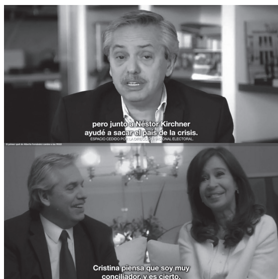
Figura 5. Spot de Alberto Fernández.

No se puede desconocer que estas memorias de la democracia y la competencia gubernamental encontraron en la figura de Alberto Fernández un garante idóneo. Consideraré a modo de ejemplo una pieza central: el spot de presentación de su candidatura a presidente, lanzado en redes el sábado 6 de julio de 2019, un día antes de que comience oficialmente la campaña electoral (Figura 5).