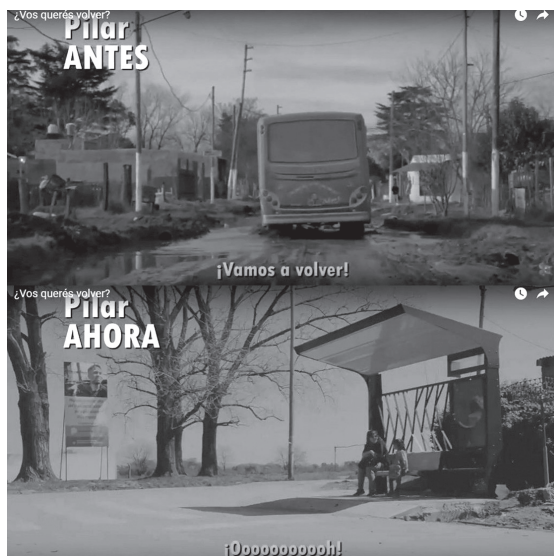
Figura 4. “¿Vos, querés volver?” Pilar antes / Pilar ahora.