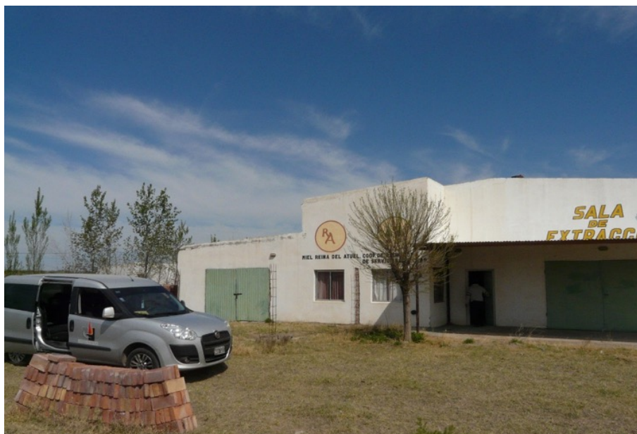
FIGURA N° 3. Sala de extracción de miel de Algarrobo del Águila