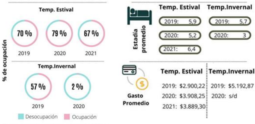
Figura 3. Dimensiones de análisis del mercado turístico de San Martín de los Andes por temporada. Años 2019-2021

Fuente: elaboración propia sobre la base de datos de la Municipalidad de San Martín de los Andes.