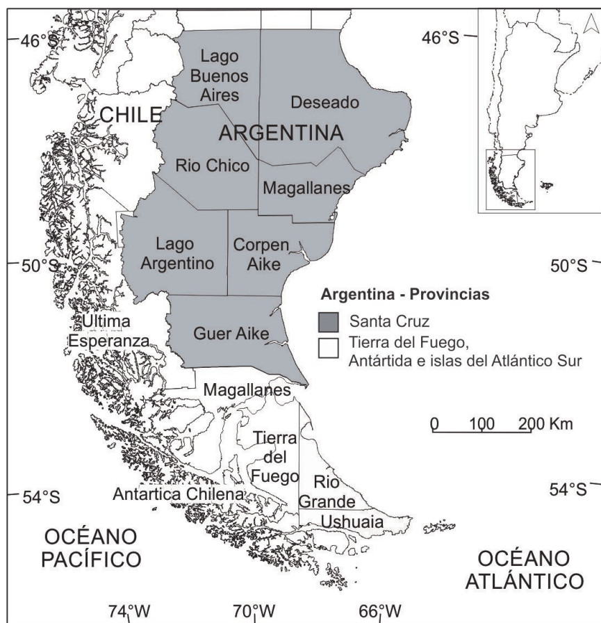
Fig. 2. Mapa político de Patagonia Austral: 1) provincias argentinas de Tierra del Fuego, Antártida e islas del Atlántico Sur (gris claro) y Santa Cruz (gris oscuro); 2) regiones chilenas de Magallanes y la Antártida chilena (izquierda en blanco).

5.- Etnia: en ocasiones, se asocian los restos a algunas de las etnias que fueron identificadas como tales durante el momento del contacto. Dicha asociación se establece entre el lugar de hallazgo de los restos y la distribución que ocupaban las poblaciones originarias. Estas son: