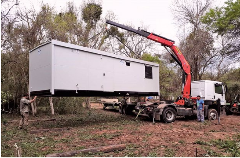
Figura 6. Módulos habitacionales instalados en septiembre del 2018