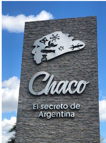
Figura 2. Panel rutero donde se presenta al Chaco como “El secreto de Argentina”

En efecto, el componente identitario vinculado a pueblos indígenas y a la ruralidad encuentra importantes ventajas comparativas como lógica de desarrollo para el Impenetrable: es un ámbito propicio para que el turista como “peregrino contemporáneo” descubra “autenticidad en otros ‘tiempos’ y otros ‘lugares’” (Urry, 2018, p. 57). En consonancia con un extenso campo de estudios locales sobre pueblos indígenas y turismo (Bidaseca, 2011; Comaroff y Comaroff, 2011; Lacarrieu, 2002), la microregión también se promociona desde el valor de la etnicidad.