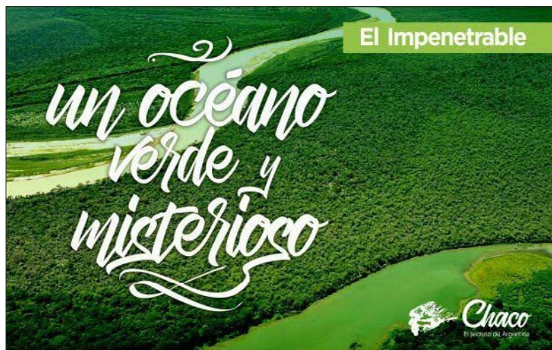
Figura 3. Pieza gráfica que forma parte de un repertorio de propaganda del gobierno provincial