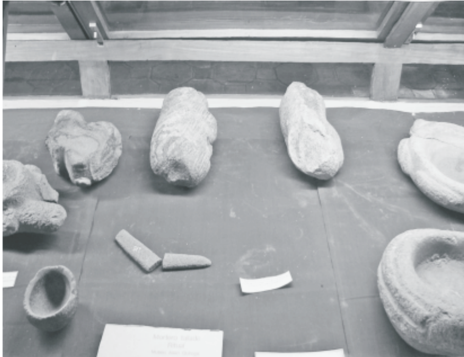
Fig. 9. Ejemplo de materiales de piedra de diferentes períodos juntos en una misma vitrina.