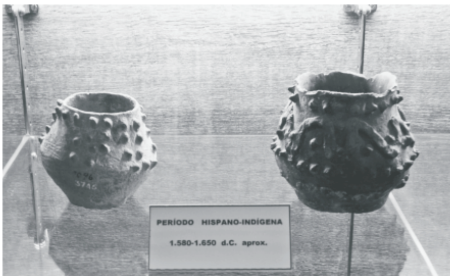
Fig. 10. Vasijas del período hispano-indígena (colonial) exhibidas en la sala de arqueología.