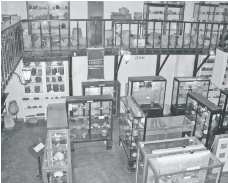
Fig. 6. Vista de la vitrina con material precerámico, sobre ella, el cartel indicador del período.