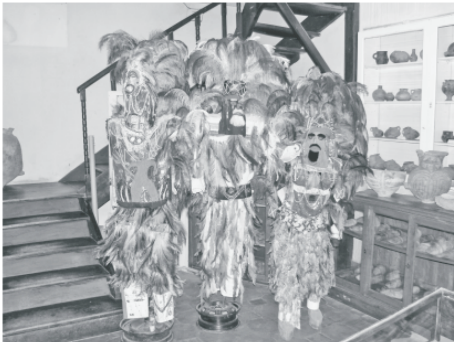
Fig. 14. Disfraces de la comparsa "Indios diaguitas y calchaquíes" de Mutquín, de reciente confección, exhibidos junto a vasijas prehispánicas y coloniales en la sala de arqueología.

entonces, por qué para muchos los indígenas están de más en el futuro. Esta narrativa en el contexto histórico-político particular en que vivimos, donde la presión sobre las tierras de comunidad se ha incrementado, produce que las posibilidades de condensación o sutura de una identidad indígena queden estrechamente limitadas. Esta limitación es doble: por un lado, la enseñanza formal de la escuela, tanto en los centros urbanos como en las mismas comunidades campesinas, narra una historia de aniquilación de lo indígena, reafirmada frecuentemente por los textos arqueológicos, mientras que, por otro lado, esta narrativa es materializada y así fijada en los museos a manera de monumentos de una memoria 'inmemorial'. Esta doble limitación promueve el no auto-reconocimiento y en aquellos casos en los que éste se produce, promueve la deslegitimación del mismo por parte de los otros no indígenas, apareciendo en el repertorio de