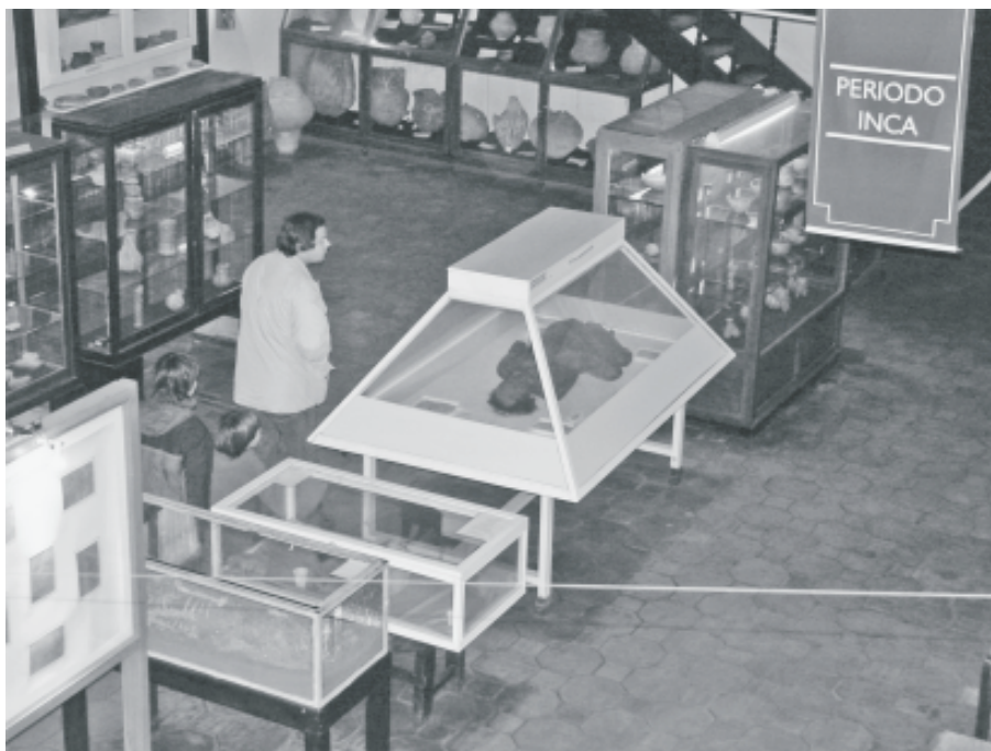
Fig. 8. Vitrinas con cuerpos momificados en el centro del salón de arqueología

Cada uno de los períodos (Precerámico, Temprano, Medio, Tardío, Inka e Hispano-indígena) está señalado con el correspondiente cartel que no sólo indica el lugar de la historia en que uno se encuentra, sino que, por estar escritos de un sólo lado, señalan la forma correcta en que la historia debe ser recorrida y aprehendida reforzando textualmente la coreografía que el ordenamiento de las vitrinas impone materialmente. El recorrido histórico que acabamos de sintetizar, quizá en exceso, da cuenta de una historia prehispánica continua. La adyacencia de las