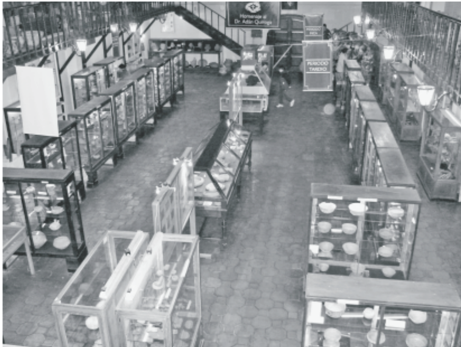
Fig. 1. Vista general de la sala de arqueología del Museo Adán Quiroga