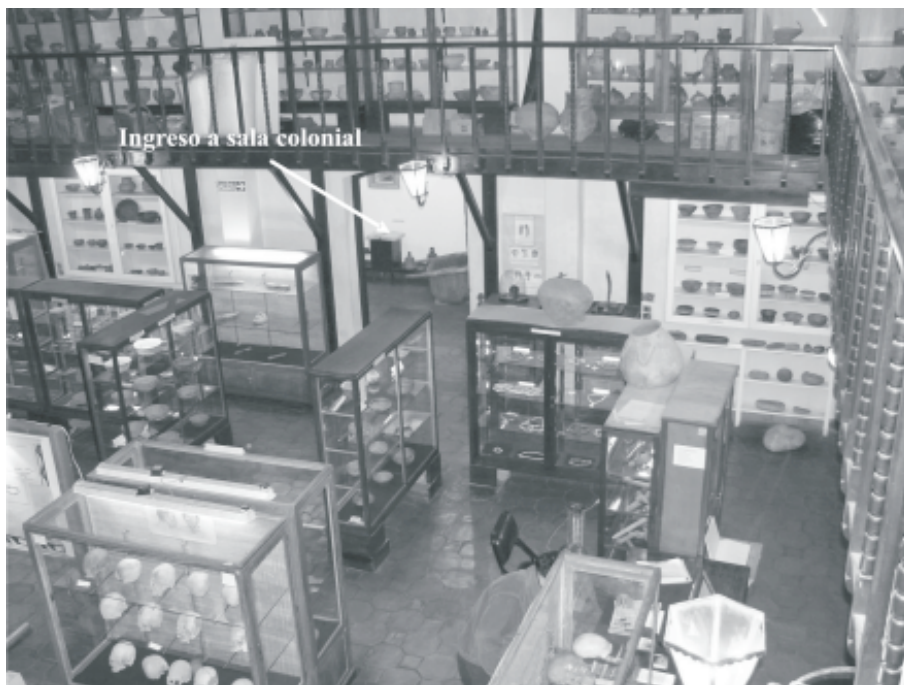
Fig. 11. Vista del acceso a la sala colonial desde la sala de arqueología.

demo acercarnos a una respuesta si analizamos los objetos presentes y los ausentes en cada sala. Para ingresar a la sala colonial se debe transponer una puerta que se ubica a un costado del salón arqueológico, como indica el cartel montado sobre un dintel. Esto implica, por lo tanto, que lo arqueológico quedó atrás en el espacio y en el tiempo. Entre los objetos exhibidos en la sala colonial se destacan un pesado carruaje de la década de 1850 donado por los descendientes de un gobernador (Fig. 12), el sable y mandil de la montura del Teniente Coronel Estanislao Maldones (1854-1934) (Fig. 13), máquinas de escribir, una colección de armas de fuego del siglo XIX y comienzos del XX, planchas de hierro (para planchar ropa), moldes de velas, mates (para tomar mate), estribos de madera, entre otros. Ninguno de los objetos expuestos en la sala colonial corresponde, de acuerdo a su cronología, al período colonial, sino al republicano. No es que el museo Adán Quiroga no posea objetos del período