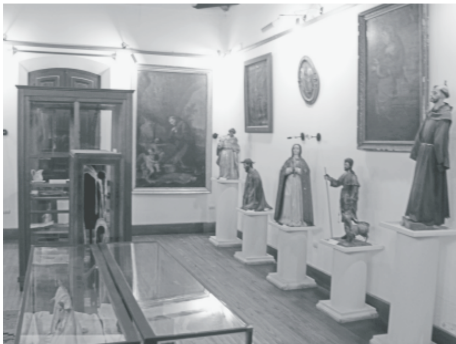
Fig. 3. Vista general de la sala Fray Mamerto Esquiú.

Este se estructura en dos niveles, por un lado se ordena en la secuencia de salas (arqueológico – colonial/religioso) y por otro lado ordena la distribución en el amplio salón de arqueología. Vamos a comenzar por este último nivel. Las vitrinas que contienen las piezas arqueológicas están dispuestas una junto a otra formando pasillos que prescriben y proscriben rígidamente la circulación. Esta suerte de laberinto conduce al visitante a lo largo del “hilo de la historia”. La experiencia es la siguiente: al ingresar al salón uno se encuentra con la primera barrera (Fig. 4). Una fila de vitrinas impide el avance y deja libres dos direcciones posibles, derecha o izquierda. Pero antes de tomar una decisión debe uno dirigirse al escritorio ubicado justo frente a la puerta de acceso donde el empleado municipal realiza el cobro de la entrada e inmediatamente indica que la dirección “correcta” es hacia la izquierda. Al girar en la esquina se arriba a un sector demarcado con un cartel que dice