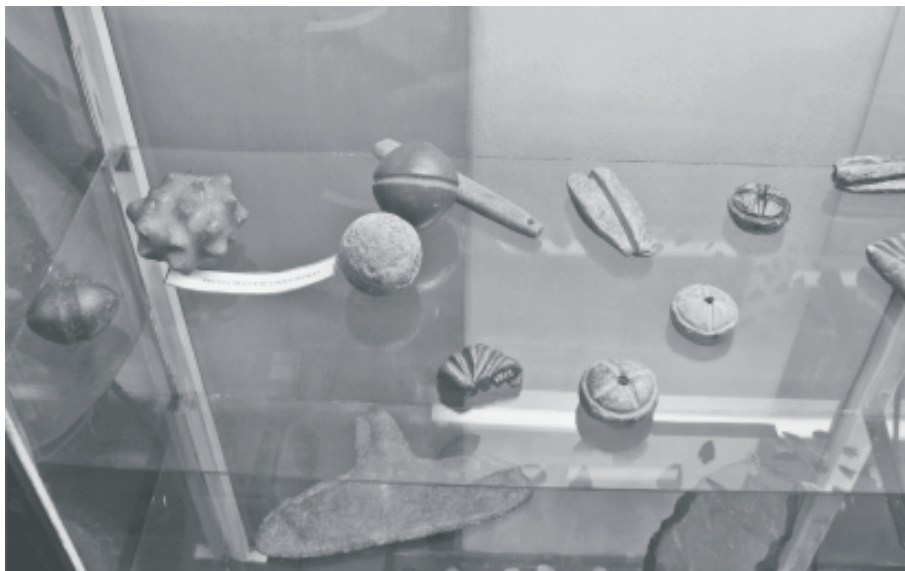
Fig. 7. Materiales exhibidos en la vitrina del período Precerámico.