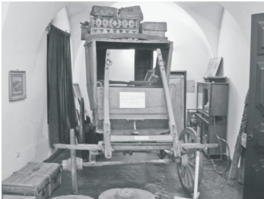
Fig. 12. Carreta exhibida en la sala colonial (ca. 1850)