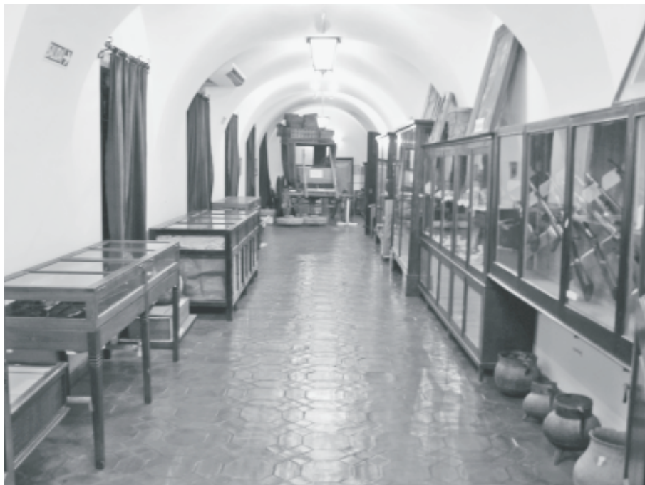
Fig. 2. Vista general de la sala de historia colonial