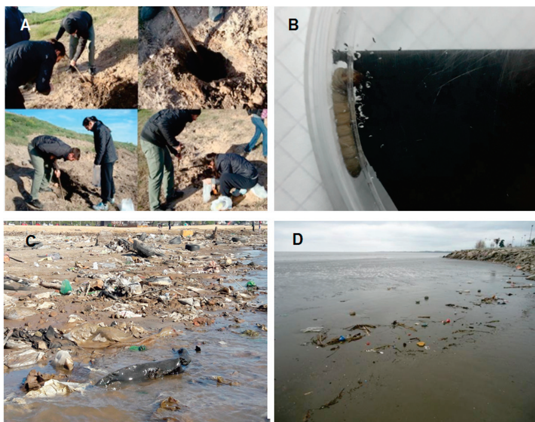
Figura 2. Imágenes representativas de los estudios presentados durante el simposio “Ecología de residuos plásticos: ¿Qué estudiamos en Argentina?”, en la XXVIII Reunión Argentina de Ecología. A) Muestreos de bacterias en rellenos sanitarios de Santa Fe; B) Galleria mellonella consumiendo silobolsa en ensayos de laboratorio; C) Sitio de muestreo de biota y residuos plásticos en el río Paraná; D) Sitio de muestreo de biota y residuos plásticos en el Río de la Plata.

En basurales de Santa Fe y del mundo, los plásticos conforman la mitad de los residuos. Un tipo común de residuo es el polipropileno biorientado (BOPP), que por su bajo costo y alta versatilidad se utiliza en muchos productos, incluyendo embalajes; por ello se acumula en la naturaleza. En su estudio sobre bacterias aisladas en suelos de rellenos sanitarios que degradan materiales plásticos, Argaraña y colaboradores (resultados no publicados) presentaron a la degradación microbiana como una posible tecnología de minimización de este tipo de residuos. Durante la biodegradación, diferentes enzimas de los microorganismos descomponen los polímeros complejos en moléculas más simples para ser utilizados como fuentes de carbono y energía. Para probar cómo actúan microorganismos aislados del relleno sanitario de Santa Fe (Figura 2A), el equipo aisló e identificó estos