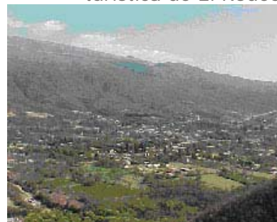
Imagen del ambiente de la villa turística de El Rodeo

Localización de El Rodeo y del Departamento Ambato en la provincia de Catamarca, Republica Argentina