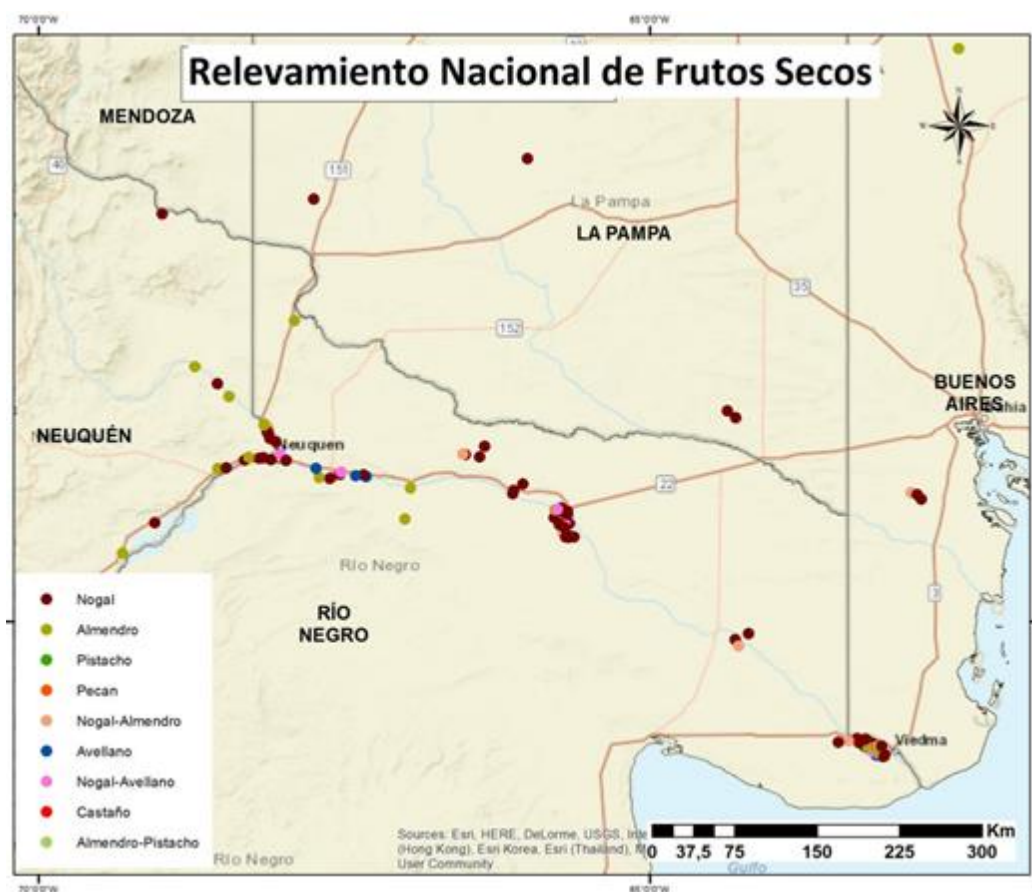
Figura 1. Distribución de establecimientos productores de frutos secos, por especie, 2017