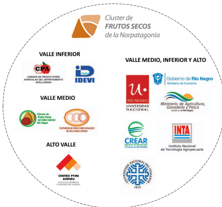
Figura 2. Asociación Civil del Clúster de Frutos Secos de la Norpatagonia

En 2013 se conformó una nueva acta constitutiva con la incorporación de los productores de la zona de Alto Valle de Río Negro y Neuquén. La asociación cambió su denominación por el nombre actual: Asociación Civil del Clúster de Frutos Secos de la Norpatagonia. La asociación avanzó, de esa manera, en el fortalecimiento de la coordinación de la cadena y se expandió en el territorio. La figura 2 muestra la composición definitiva de la Asociación.