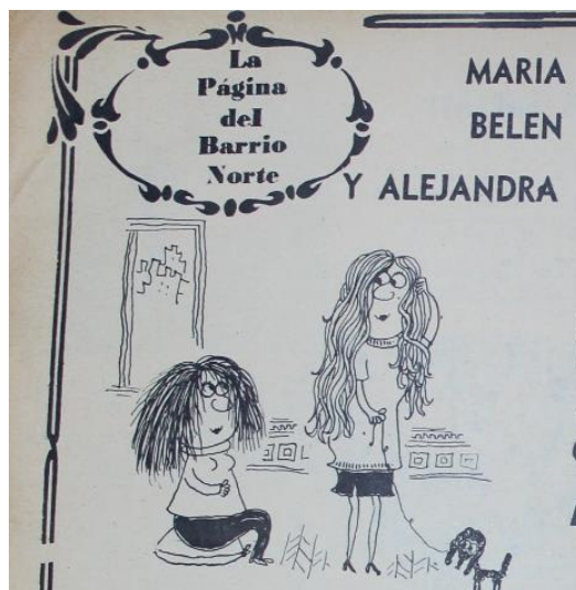
Ilustración 2: detalle de la viñeta de “La Página de Barrio Norte”.

signados por un consumo ocioso alejado de cualquier responsabilidad dando cuenta de un status acomodado: las picadas, los bailes en “Mau Mau”, la asistencia a bares de moda, la música que escuchaban, la vestimenta, marcaban signos de distinción. Contrariamente, Mirna Delma aparecía como la representante de la cultura mersa con sus tiradores a lo Rita Pavone, sus pañuelos de gasa sobre los ruleros, sus colores estridentes, su lugar de residencia en Floresta y su afición por el “Club del Clan” (Palito Ortega, Violeta Rivas, Johnny Tedesco). Si bien hay una representación dicotómica, su parentesco y origen común daría cuenta de un proceso dentro de las clases medias en el cual se reflejaron diferentes resultados económicos y culturales.