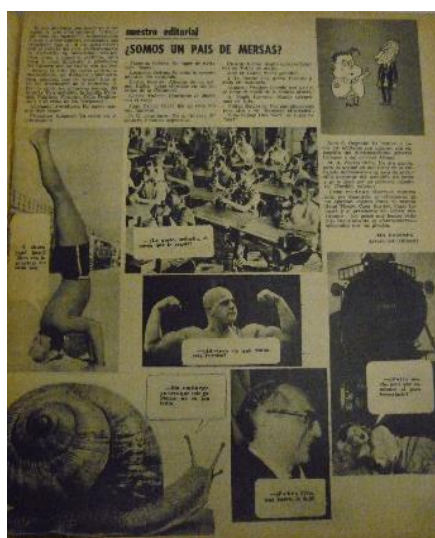
Ilustración 4: Tía Vicenta , n° 298, marzo de 1965.

Si nos ponemos una mano en el corazón y nos preguntamos: ¿somos un país de mersas?, honestamente y muy a pesar nuestro tendremos que responder que sí. Si los gobernantes son el reflejo del país evidentemente la Argentina es mersísima. Analicemos, pues, a nuestros políticos, militares y clase dirigente y señalemos las razones por las cuales son mersas.