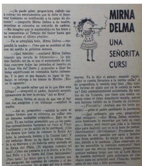
Ilustración 5: Tía Vicenta , n.º 279, marzo de 1964.

El personaje de Mirna Delma aparece en la revista en marzo de 1964. Allí, en una columna titulada: “Mirna Delma, una señorita cursi” ( Tía Vicenta , n.º 279, marzo de 1964), se