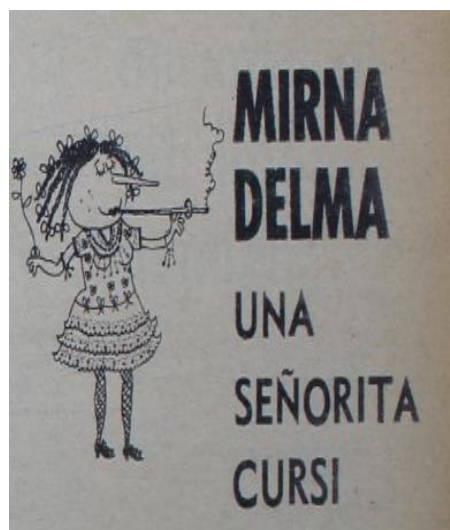
Ilustración 3: detalle de la viñeta de la página de Mirna Delma.

En el imaginario de Colombres, los intentos de los mersas de parecerse a otros serán vanos, al errar en las elecciones del lenguaje, los espacios de sociabilidad, los modos de vestirse, las selecciones musicales y deportivas. Finalmente, en esos detalles se percibe el origen inmigrante de la sociedad en cuestión del cual es difícil salir. Las marcas de origen aparecen tarde o temprano, evidenciado en múltiples oportunidades, enunciado ex profeso por el autor. Los términos “finishela” de boca del padre de Mirna como los modismos utilizados por ella como “ir de la feria” en vez de “ir a la feria” dan cuenta de determinados sesgos culturales de mediana duración. A partir de los indicios brindados, la raíz inmigratoria italiana tradicionalmente identificada desde la literatura decimonónica con el cocoliche o la vulgaridad, en obras que se oponían abiertamente a la inmigración europea, en especial la de origen italiano con autores como Eugenio Cambaceres o Juan Antonio Argerich, sigue presente en la cultura argentina (Blengino, Devoto). Nuevamente, la lectura de las viñetas aporta una clave original para entender las diferencias sociales en un país que denotaba desde principios de siglo una dinámica acelerada y trayectorias económicas con resultados disímiles, evidenciando desfasajes culturales y distinciones, intentos de emulación y segregaciones.