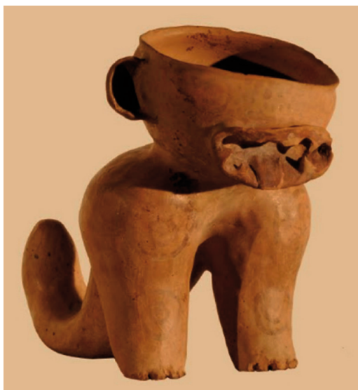
Figura 1. Pieza N° 191. Estilo Ciénaga, colección Di Tella, N° de inventario original 8944. Museo Nacional de Bellas Artes.

En cuanto a la morfología de las representaciones, se registraron 327 casos de efigies y 211 de no efigies.