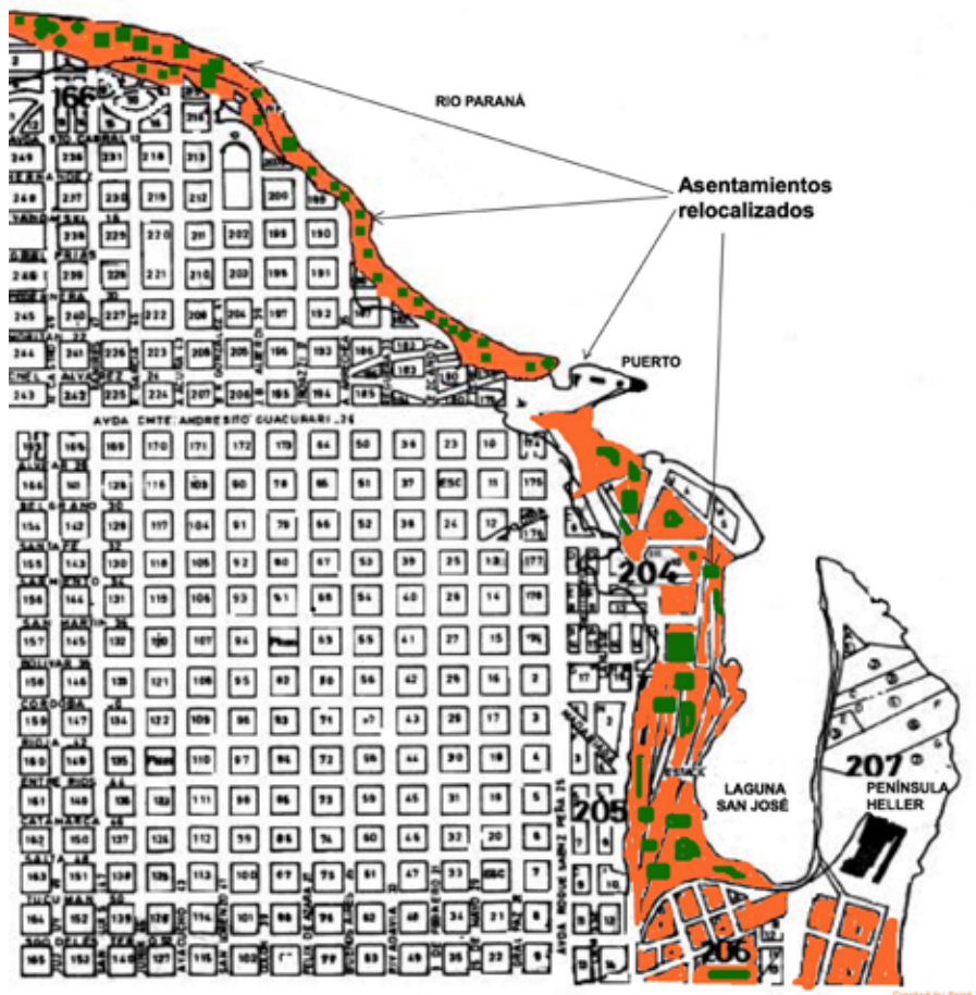
Figura 1. Mapa del área costera pericentral desplazada y renovada.

La elevación gradual de los niveles del río Paraná implicó un énfasis en el tratamiento costero, desarrollándose el ambicioso “Proyecto Costanera” que significó el mayor programa de renovación urbana en la ciudad de Posadas. En 1997, el proyecto Costanera fue un acuerdo firmado entre la Municipalidad de Posadas y el Gobierno Provincial, en paralelo a los esperados aumentos de la cota del emprendimiento Yacyretá. 8 Propuesto como una “obra del siglo”, el proyecto planteó a nivel ideológico/discursivo una modificación del paisaje urbano, con fines recreativos, urbanísticos, etc., lo que ayudó a fomentar distintas