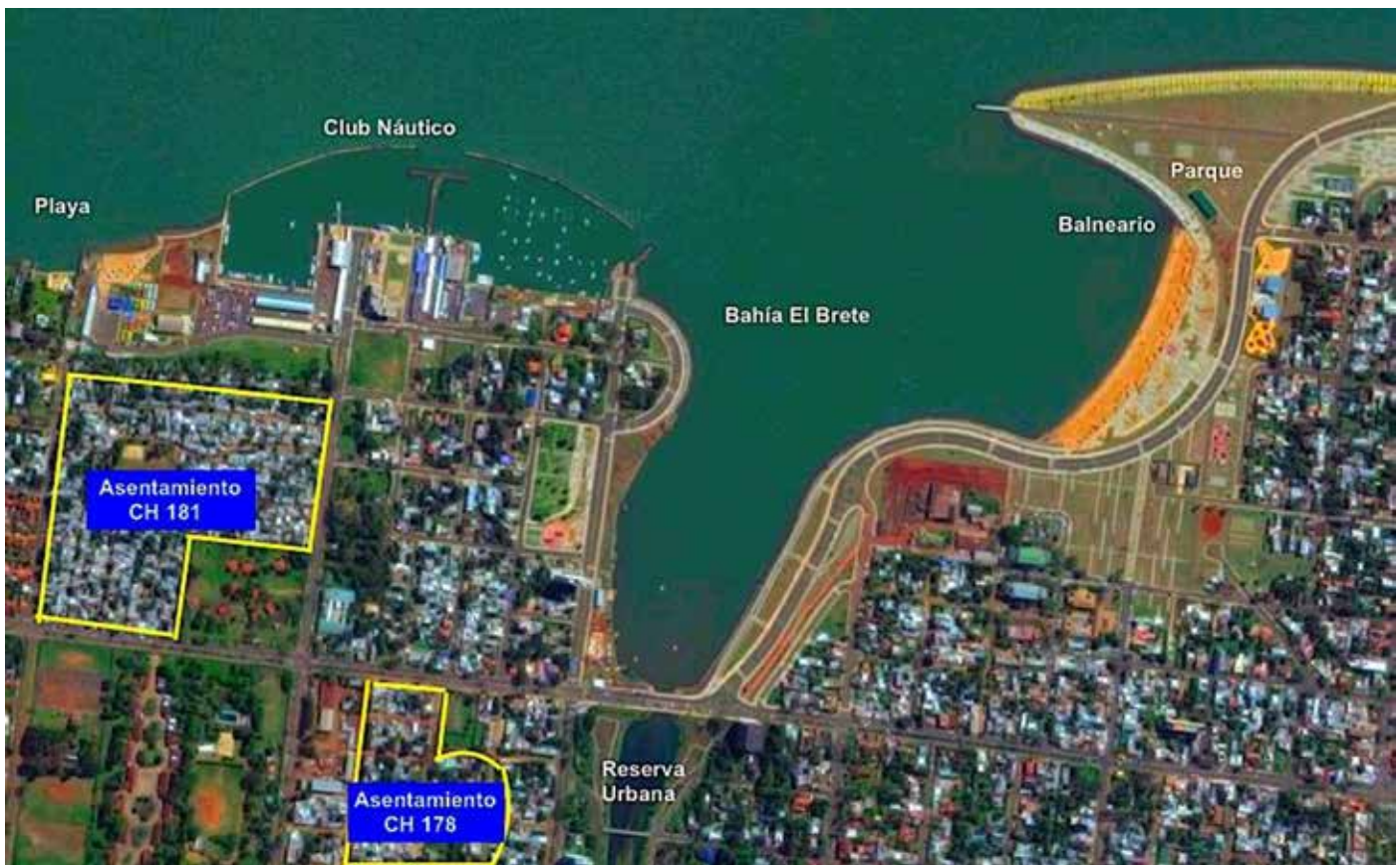
Figura 5. Nueva área costera de la Bahía El Brete y los asentamientos que persisten.

emergidos otros asentamientos en distintos puntos de la trama urbana y se han sumado a aquellos que permanecieron en los intersticios de la renovación urbana. Es notorio que los lugares que ocupan estos asentamientos son residuales, intersticiales, pero estratégicos en el contexto urbano. Son residuales frente al avance de las obras de infraestructura que fue dejando la ciudad formal, y estratégicos de cara a las estructuras de oportunidades que otorga su ubicación: proximidad al trabajo, a los nuevos espacios de esparcimiento, minimización de tiempos, distancias y costos de transportes.