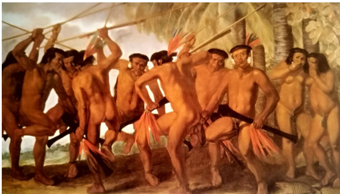
Imagen 2. Albert Eckhout: Tapuya-Tanz, 1646-1653. Ó/L, 172x295 cm.