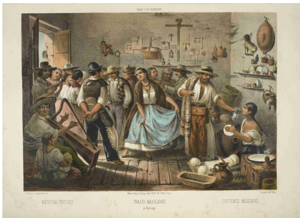
Imagen 1. Trajes mexicanos, un Fandango

También el patriciado hispano de naturales, mestizos, vascos y de otras naciones de los reinos peninsulares, performaran sus danzas con comidas y bebidas. Al respecto, los saraos de danzas de fines del período colonial se realizaban en lugares cerrados y particulares y en los que se servían comida y bebida (López Cantos, 1992: 72). Y en los fandangos novohispanos del XIX se comía y bebía durante el baile (ver imagen 1). Por eso es que el obispo del Tucumán, en un edicto que se publica en Jujuy y las otras ciudades de la jurisdicción eclesiástica, denuncia que en las fiestas religiosas acaecen “por muchos días donde no se ven sino borracheras destemplanzas, juegos, fandangos, hurtos, pependencias, puñaladas y muertes [...]”. 15