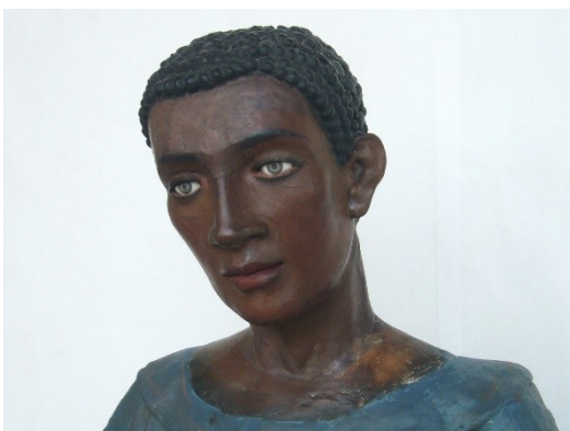
Imagen 4. San Benito de Palermo