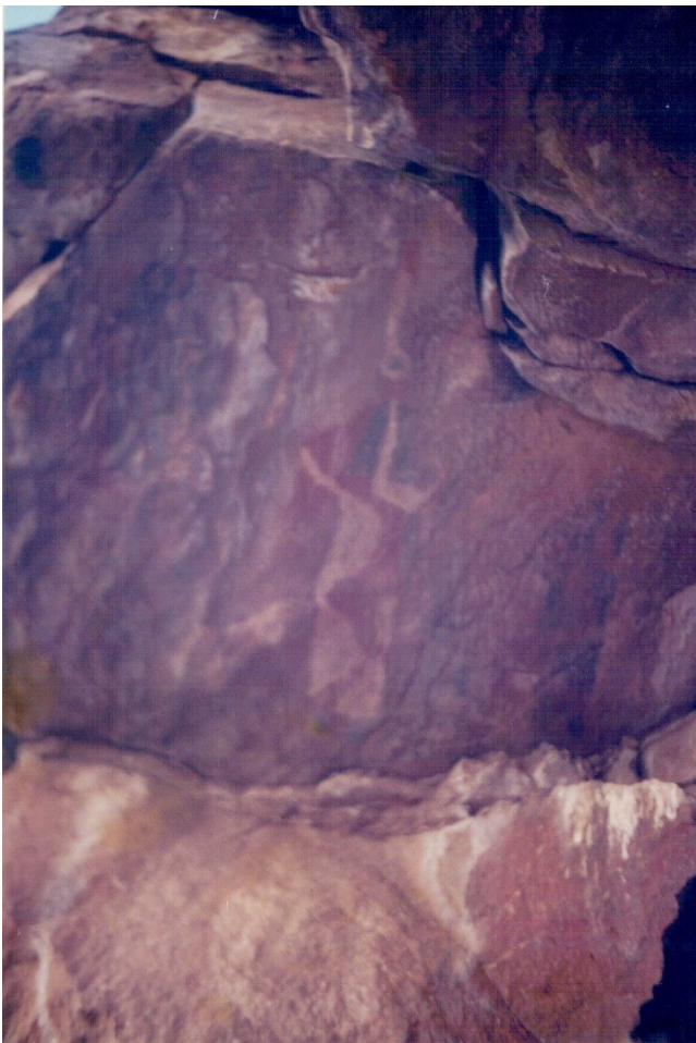
Imagen 3. Shaman/pájaro

Fuente: pintura rupestre de Corané, Humahuaca (Jujuy, Argentina). Fotografía del autor del 15 de enero de 2003.